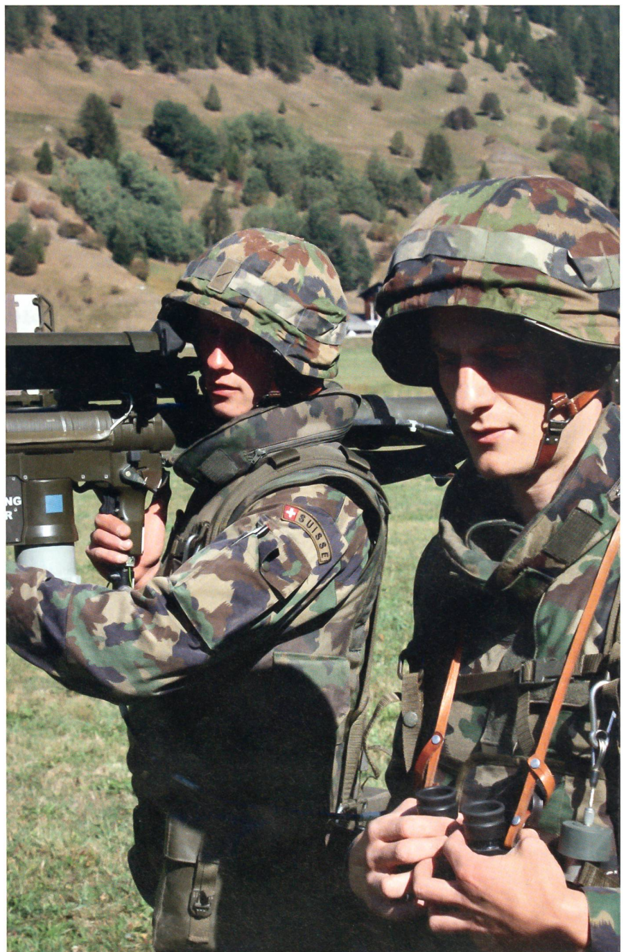
Moderne Ausbildung an der Fliegerabwehrenkwaffe Stinger im Obergoms.

Für jeden dieser Typen von Modulbausteinen (z.B. Br Stab, Inf Bat, Pz Bat oder Log Bat) sind die Vorgaben individuell de-