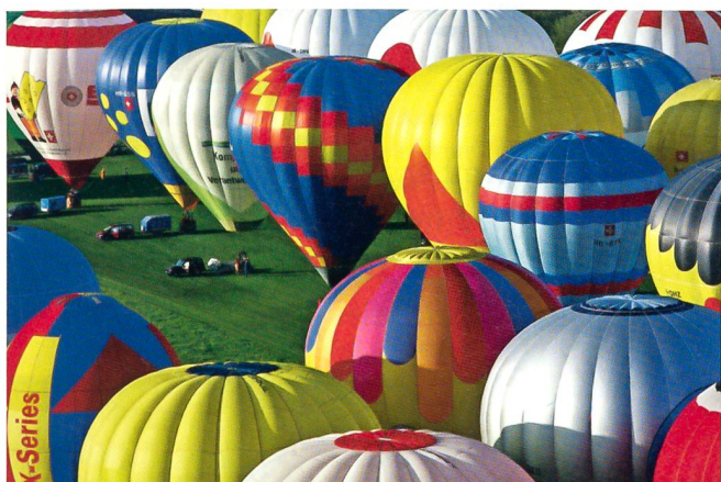
Freude herrscht: Ballone am Start.