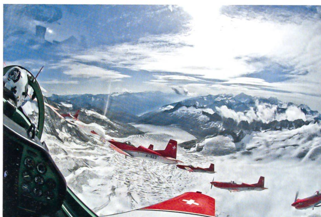
Eine Visitenkarte: Das PC-7-Team im Jahr 2008.