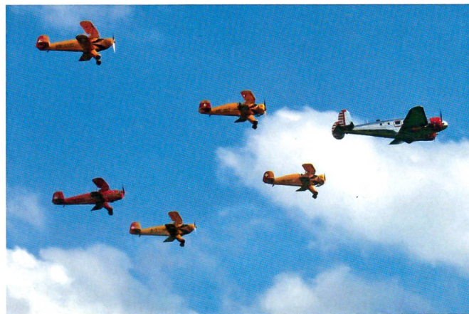
Pioniere der Luftfahrt: Die Wimmer-Bü-Staffel.