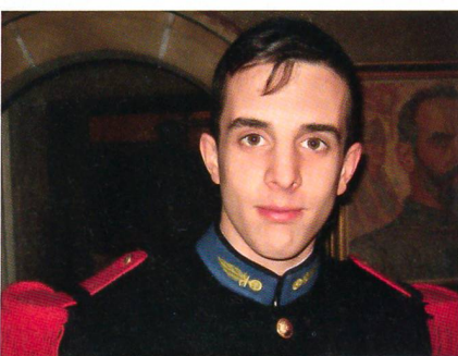
Einer der Kadetten, die für einen Tag nach Colombier abkommandiert worden waren. Sie stachen im bisherigen Lehrverband durch besonders gute Leistungen hervor und wurden mit der Reise in die Schweiz belohnt.

Mit der französischen Militärschule von Saint-Cyr verbindet Brigadier Chabloz eine enge Kameradschaft. Aus diesem Grunde kamen zwei Hauptleute und zwei Kadetten von Saint-Cyr nach Colombier.