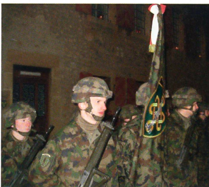
Die Aspiranten der entbehrungsvollen Infanterie-05 bilden die Ehrenformation.