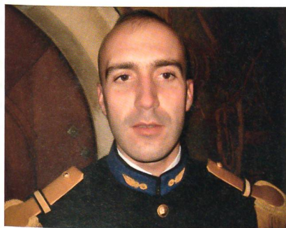
Einer der Hauptleute, die Saint-Cyr in Colombier vertraten. Am Ende der Lehrgänge wählen die Jahresbesten ihre Waffengattung aus. Eine besondere Ehre ist es, im Lehrkörper von Saint-Cyr zu dienen.