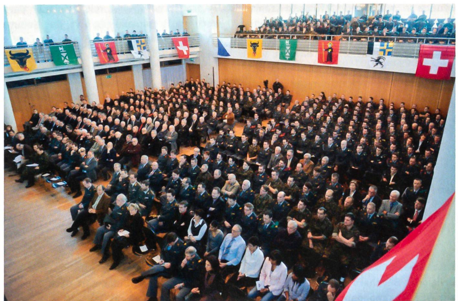
Volles Haus am «Graubünden Military Forum Landquart».