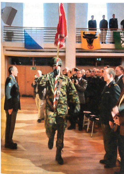
Einmarsch der Standarte Geb Inf Br 12.