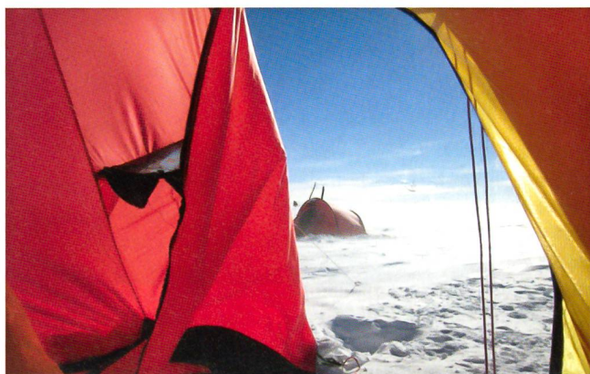
Der unheimliche Blick durchs Zelt in die Wildnis.