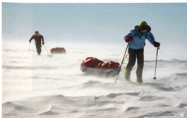
Der beschwerliche Weg durch die Antarktis.