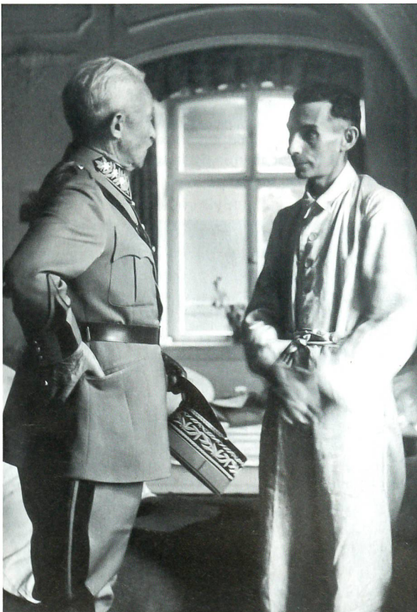
Der Schweizer General spricht mit einem ehemaligen KZ-Häftling auf der Insel Mainau.