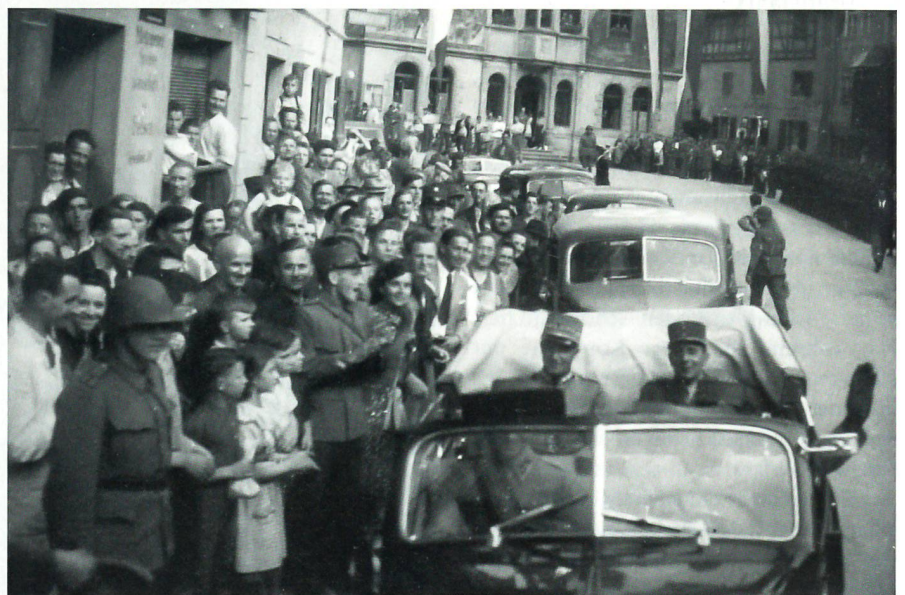
General Guisan lässt es sich nicht nehmen, den französischen General persönlich in seinem offenen Wagen an die Grenze bei Ramsen zurückzubegleiten.

Major Barbey hat vieles in seinen beiden Büchern «Von Hauptquartier zu Hauptquartier: mein Tagebuch als Verbin-