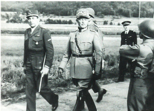
Die beiden Generäle beim Abschreiten der von beiden Armeen gebildeten Ehrenkompanie an der Grenze.