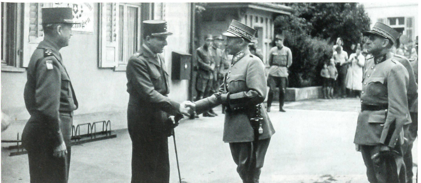
General de Lattre de Tassigny heisst General Guisan in Kreuzlingen zum Gegenbesuch in Konstanz willkommen.