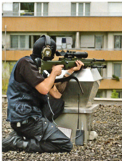
Weltweit verlassen sich immer mehr Scharfschützen auf die Qualitätspatronen der RUAG.