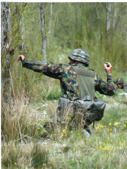
Die in Thun entwickelte und hergestellte Handgranate gilt als Spitzenprodukt bezüglich Handhabung und Wirkung im Ziel.

Anzündhütchen: In der Jagd- und Sportmunition kommt die Boxerzündung zur Anwendung. Patronen für den militärischen Einsatz brauchen in der Regel die Berdanzündung.