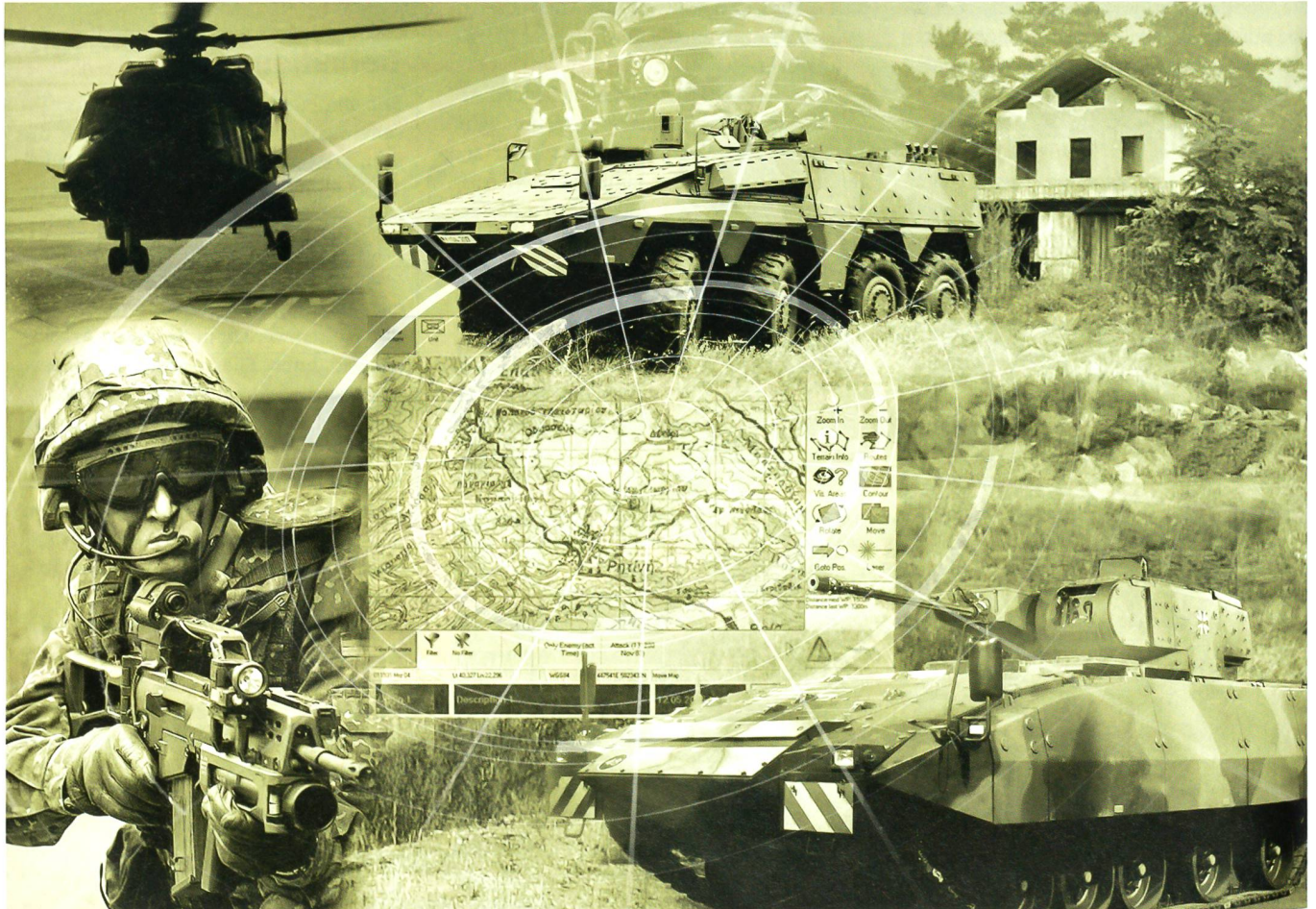
Die europäische Zusammenarbeit im Bereich der Rüstung drängt sich bei den verschiedensten Beschaffungsvorhaben auf.

Die EVA hat aber immer wieder mit der fehlenden Bereitschaft zur Kooperation von EU-Staaten zu kämpfen. Der Grund dafür liegt in den vorgeschobenen unterschiedlichen nationalen Sicherheitsinteressen. Langfristig Abhilfe schaffen und unter-