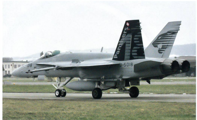
Die Staffelmaschine der Fl St 18.