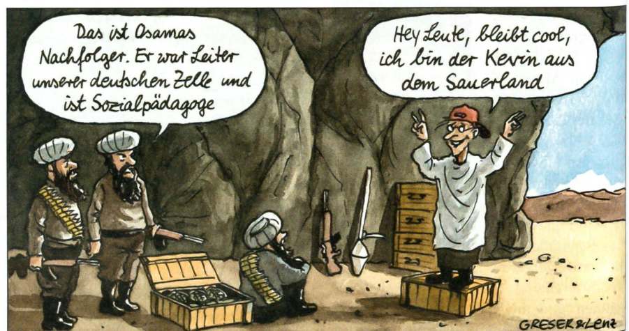
Kann Deutschland den Afghanen wirklich helfen?