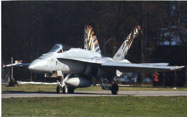
Die Staffelmaschine der Fl St 11.