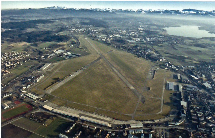
Seite 29: Dübendorf muss Militärflugplatz bleiben.