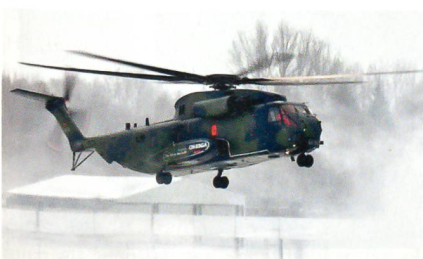
Jungfernflug des CH-53GA in Donauwörth.

Nach den Trainingsflügen Anfang 2011 und der ersten Übergabe im gleichen Jahr können die Bundeswehrosoldaten mit dem CH-53GA mit moderner Ausrüstung internationale Missionen (z.B. Afghanistan) unterstützen. Ziel der Produktverbesserung CH-53G war es, diesen Helikoptertyp mit der Fähigkeit auszustatten, für verschiedene nationale und internationale Missionen einsatzbereit zu sein. Dabei wurden die