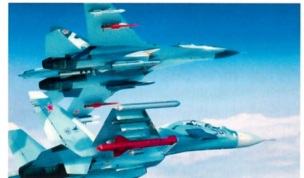
Kampfflugzeuge des Typs Su-27SK und Su-30MK in enger Formation.

Die vietnamesische Regierung hat mit Russland einen Vertrag über eine Milliarde US-Dollar zur Lieferung von 12 Kampfflugzeugen des Typs SU-30MKK abgeschlossen. Die SU-30MKK ist ein zweiseitiges