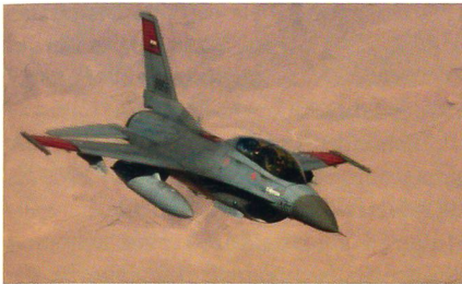
F-16 der ägyptischen Luftwaffe.

Die ägyptische Regierung beabsichtigt 24 Kampfflugzeuge des Typs F-16C/D Block 50/52 inklusive Ersatzteile, Waffen und weiterem Zubehör mit einem Gesamtwert von 3,2 Milliarden US-Dollar zu kaufen, um die Luftstreitkräfte weiter zu modernisieren. Die ägyptische Luftwaffe hat mit ak-