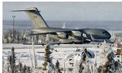
C-17 Globemaster der kanadischen Luftwaffe.

Während die Produktion des amerikanischen Transportflugzeuges C-17 nur noch in eingeschränktem Masse fortgesetzt wird, wurde nun vom Hersteller Boeing bekanntgegeben, dass das globale C-17 Globemaster