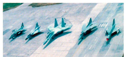
Die aktuelle Kampfflugzeugflotte der indischen Luftwaffe