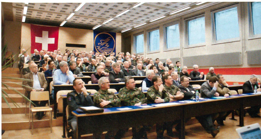
Gespannte Aufmerksamkeit an der Versammlung in Payerne.