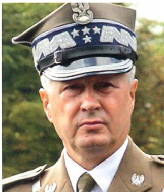
General Franciszek Gągor, Generalstabschef der polnischen Streitkräfte.