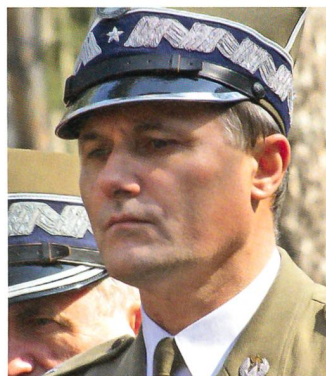
Brigadegeneral Kazimierz Gilariski, Kommandant der Garnison der Hauptstadt Warschau.