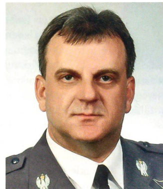
Generalleutnant Andrzej Blasik, Kommandant der polnischen Luftwaffe.