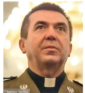
Generalmajor Tadeusz Płoski, der Feldbischof der polnischen Streitkräfte.