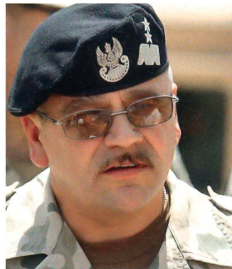
Generalmajor Tadeusz Buk, Kommandant der polnischen Landstreitkräfte.