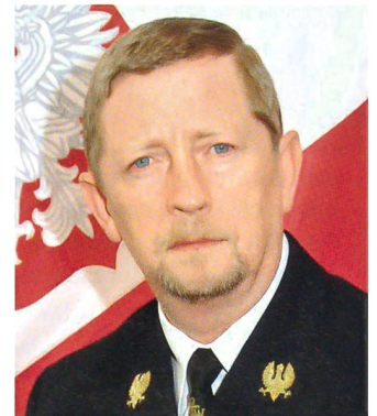
Vizeadmiral Andrzej Karweta, Kommandant der polnischen Seestreitkräfte.