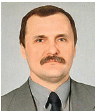
Generalmajor Włodzimierz Potasinski, Kommandant der polnischen Sonderstreitkräfte.