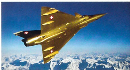
Der goldene Mirage macht Furore.

Nein, der SCHWEIZER SOLDAT ist nicht so reich, und er musste den Mirage auch nicht golden anstreichen. Es war die Luftwaffe, die 1999 den letzten Mirage-