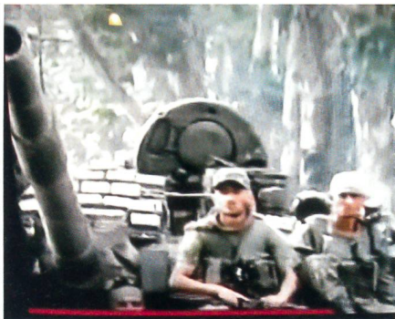
Unschärfes Bild ab Fernsehen: Panzerangriff in der Mütze?

Wer nun rollende russische Panzer mit geschlossenen Luken in Angriffsformation erwartete, der wurde enttäuscht: Die Bilder