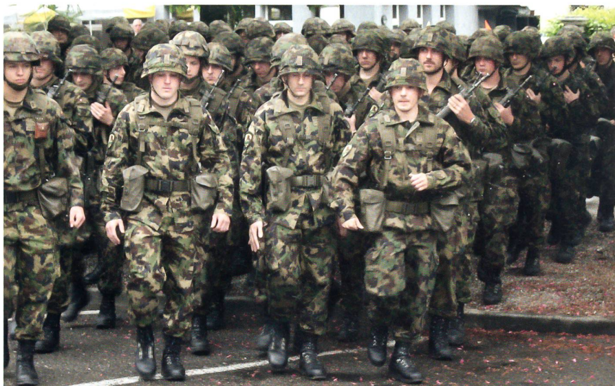
Frauenfeld, Promenade: Zum letztenmal marschiert die Artilleriebatterie 32/1 ab.

Den Schluss-WK bestritt die Art Abt 32 vom 15. Mai bis zum 4. Juni in den klassischen Artilleriegefelden Bière und Frauenfeld. Am 2. Juni fielen auf der Frauenfelder Allmend die letzten Schüsse: aus den Roh-