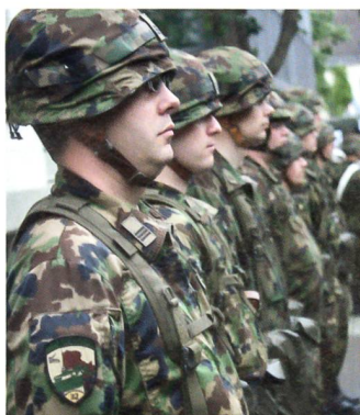
Der Abteilungsstab beim Fahnenmarsch – es grüsst nur der Kommandant.