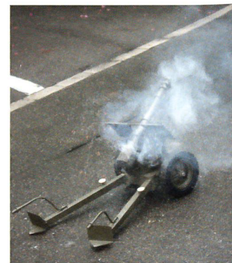
Jeder Batteriekommandant gibt aus der Miniaturhaubitze einen letzten Schuss ab.