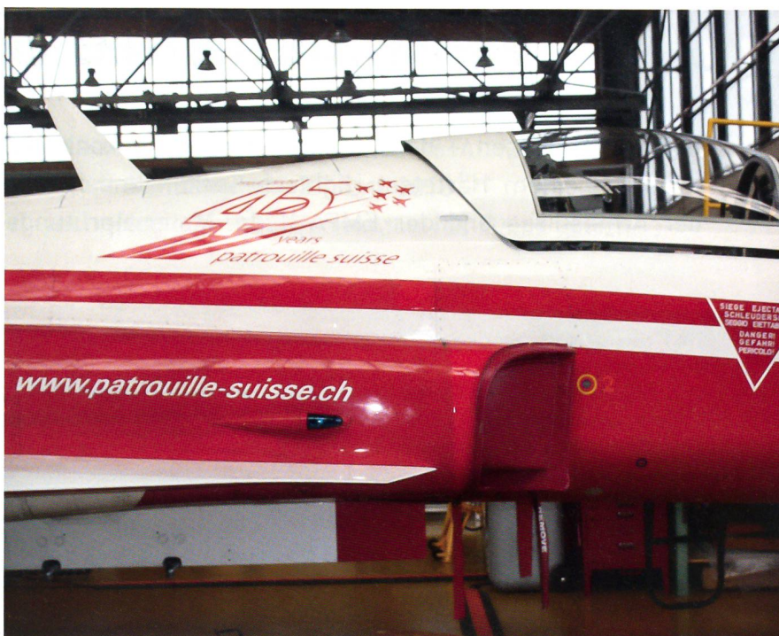
Auch die rotweissen Tiger der legendären Patrouille Suisse wollen gewartet werden.

Die AVIA habe sich zu Wort gemeldet und beobachte die Entwicklung: «Das Thema kann schlicht nicht unter den Teppich gewischt werden.»