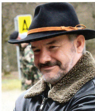
Regierungsrat Köbi Frei, Vorsteher des Ausserrhoder Finanzdepartementes.