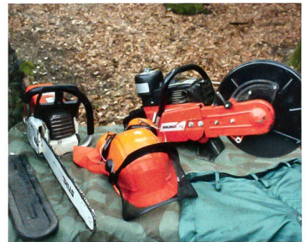
Auch das gehört zum Sappeurhandwerk.