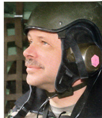
Brigadier Kellerhals, Kdt Pz Br 11: Die Führung im Kampf, im Schützenpanzer M-113.