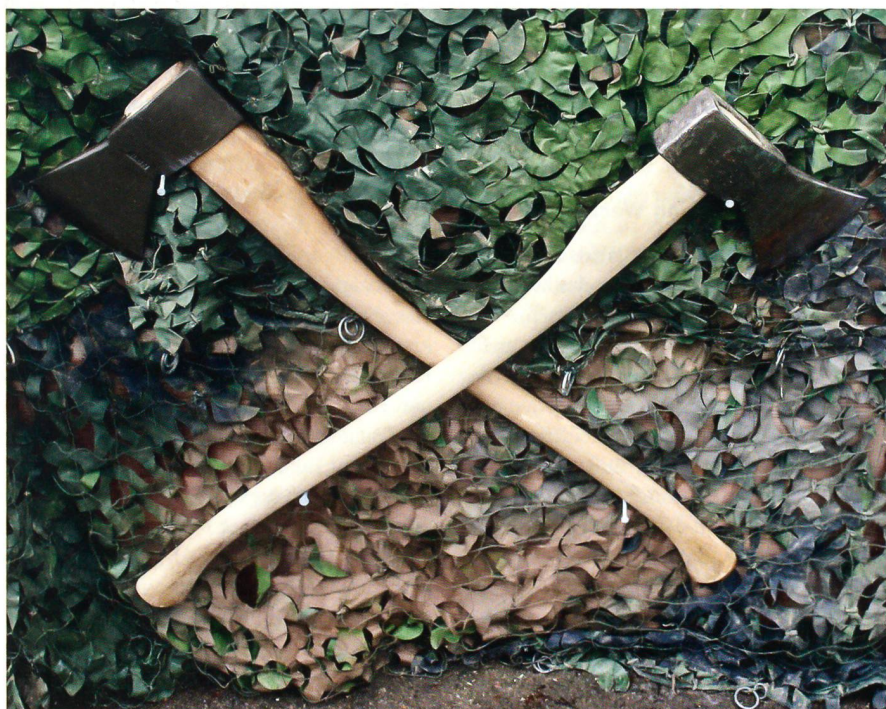
Die gekreuzten Beile: Der Stolz der Panzersappeure, einer handwerklichen Truppe.

Auf dem Feld kommen wir mit Unteroffizieren und Soldaten ins Gespräch: «Ja, es fehlt an allen Ecken und Enden», hält ein