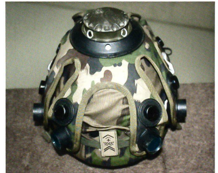
Der neue Helm für den Simulationskampf.