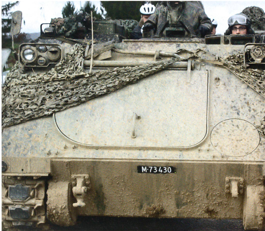
Yves Gächter: «In Bure gibt es nur zwei Aggregatzustände: Schlamm oder Staub.»