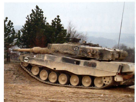
Panzerbrigade 1: «Übe, wie du kämpfst»