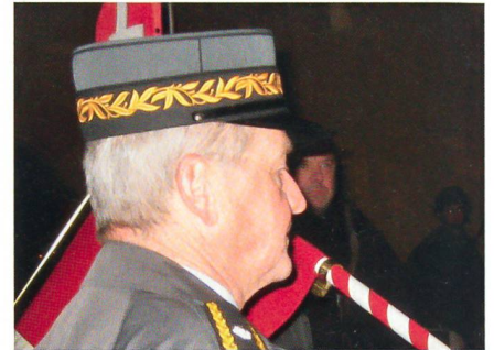
Schirmmütze: Alles rechtens.

Seit dem Tag, an dem die welschen Offiziere anlässlich der Chabloz-Verabschiedung steife Hüte trugen, treffen auf der Redak-