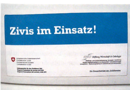
«Zivis im Einsatz!» – Die Aufschrift auf dem weissen Mercedes-Benz 2100.