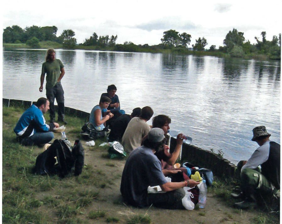
27. Juli 2010, 14.05 Uhr: Stilleben am Seerhein mit neun jungen Schweizern.

Der Zivildienstleistende arbeitet wie ein ziviler Angestellter seine Stunden am Tag und seine Tage in der Woche ab. Am Abend hat er frei, er verbringt die Freizeit