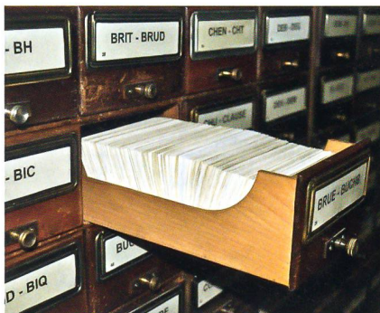
Das waren noch Zeiten: Der Zettelkasten in Stüssi-Lauterburgs Bibliothek.