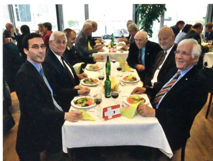
Die Treuesten der Treuen: UOV Schaffhausen mit Zürcher Verstärkung.