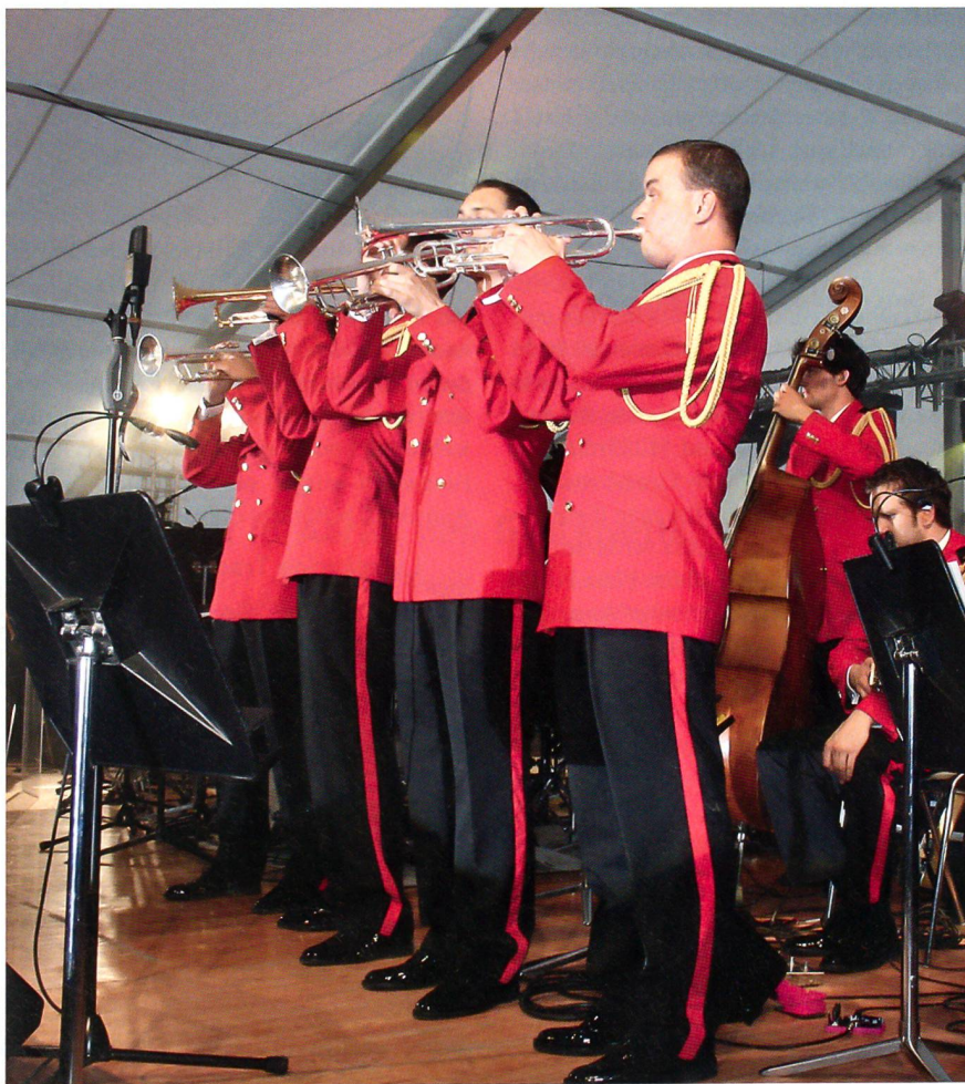
Die Band in der rot-schwarzen Uniform, am Galakonzert vom 18. Juni 2010.