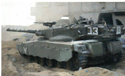
Ein israelischer Kampfpanzer Merkava im Ortskampf.

Entsprechend der Ausschreibung der kolumbianischen Landstreitkräfte nach einem neuen Kampfpanzer, liegen Angebote für modernisierte Kampfpanzer des Typs M60 oder israelische Kampfpanzer des Typs Merkava vor. Die Angebote wurden von Is-