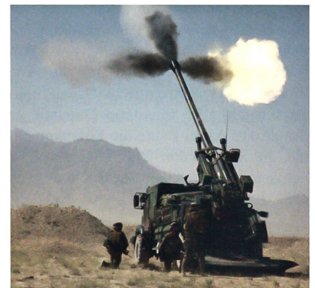
CAESAR feuert seine 155-mm-Kanone ab.

Die saudische Nationalgarde hat die ersten vier 155-mm-Selbstfahrgeschütze des Typs CAESAR (Camion Equipé d'un Système