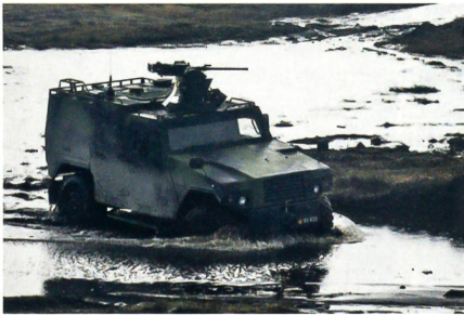
Eagle IV mit fernbedienter Waffenstation und 12,7 mm MG im Gelände.

Für die Ausschreibung «Land 121 Phase 4» in welchem die australischen Streitkräfte die aktuellen LAND ROVER durch leicht gepanzerte Fahrzeuge ersetzen will, haben es drei Anbieter in die engere Auswahl geschafft. Im Wettbewerb stehen Thales Australia mit dem HAWKEI, Force Protection