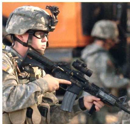
Colt M4 mit diversem Zubehör.

Die chilenischen Landstreitkräfte haben das TITANIUM-Projekt zur Beschaffung eines neuen Sturmgewehrs ausgeschrieben. Als Nachfolge oder Ergänzung von 3000 Colt M4 sollen zwischen 15 und 20 000