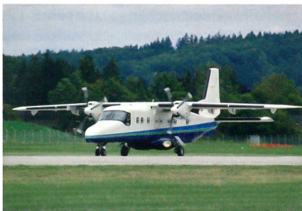
Testflug der Do 228NG.

wie ca. 300 weitere Verbesserungen an verschiedenen Flugzeugsystemen. Diese Modifikationen tragen massgeblich dazu bei,