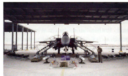
Saudi Arabische F-15S mit Waffenarsenal.

Das wichtigste Teilgeschäft ist die Ablösung der Tornado-Kampfflugzeuge durch 84 Jets des Typs F-15 Strike Eagle; möglicherweise werden die aktuell eingesetzten Flugzeuge des Typs F-15 A-d ebenfalls durch F-15 Strike Eagle abgelöst werden.