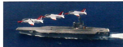
T-45 Goshawk überfliegen den Flugzeugträger USS George H. W. Bush.

Ein Jettrainer des Typs T-45 Goshawk der US Navy hat kürzlich die einmillionste Flugstunde dieses Typs bei den Marinefliegern der USA absolviert. Der zweiseitige