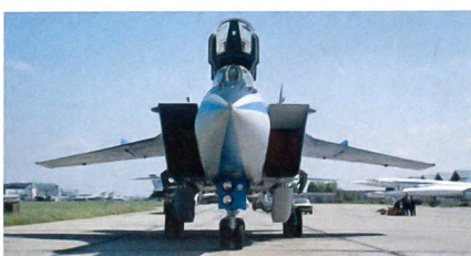
Kampfwertgesteigerte MiG-31 BM.

Die russische Luftwaffe hat die Kampfwertsteigerung der Langstreckenabfangjäger MiG-31 auf den BM-Stand abgeschlossen. Die MiG-31 BM verfügt über eine verbesserte Avionik mit digitalen Datalinks, einen neuen Mehrzweckradar, einem modernen Glas-Cockpit mit Farbdisplays, einen leistungsfähigen Rechner sowie die Möglich-