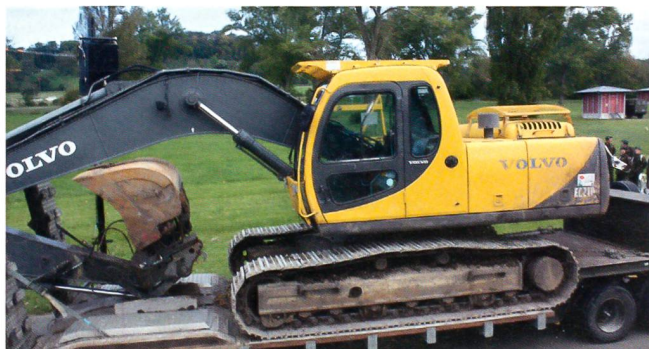
Gewaltiges «Geschütz» fuhr das Kata Hi Bat 23 auf. Das Bataillon zeigte, was es alles ins Treffen führt: Hier ein Trax, wie wir ihn im verwüsteten Schilstal schon im Ernstfall sahen.