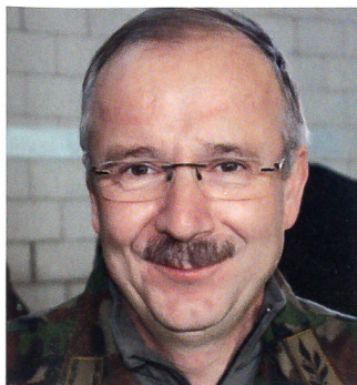
Brigadier Martin Vögeli, der Kommandant der Ostschweizer Infanteriebrigade 7.

Sehr differenziert äusserte sich Solenthaler zum gewichtigen Thema Modularität: Die Armee XXI beruhe auf der Idee, Module könnten zusammengesetzt werden. Ein derart komplexer Einsatz wie «AEROPORTO 10» am Flughafen Kloten zeige aber auch die Grenzen auf, denen die