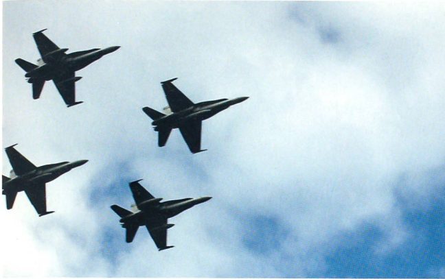
Von der Fliegerstaffel 11 aus Meiringen grüssen vier F/A-18.