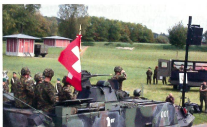
Das Inf Bat 97.