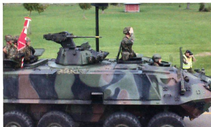
Das Aufkl Bat 5.