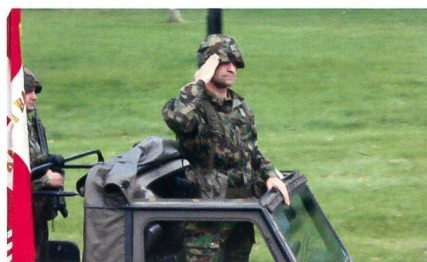
Das Kata Hi Bat 23.