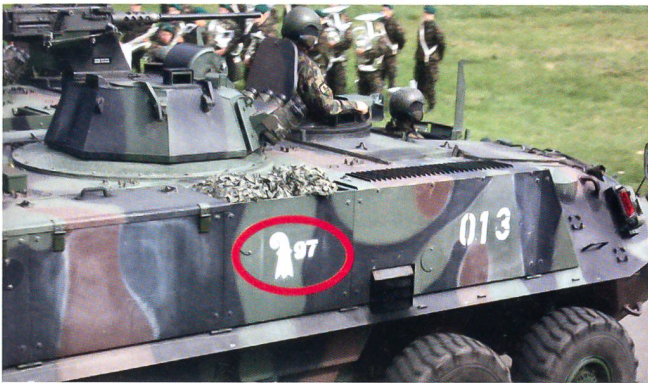
Das Inf Bat 97 legt Wert auf den Baselstab an den Panzern.