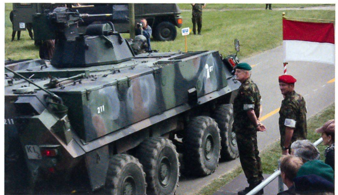
Ein Radschützenpanzer nach dem andern passiert die Tribüne.