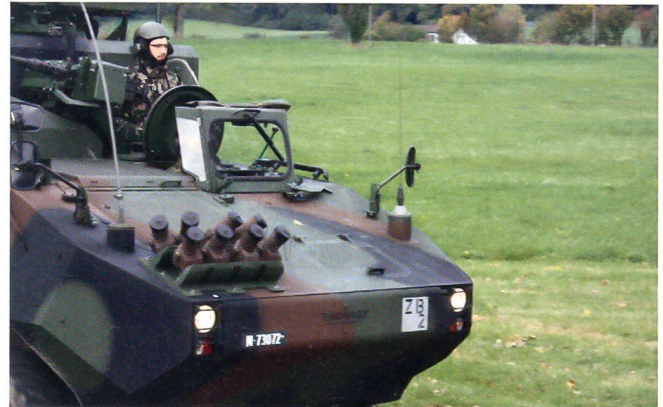
Ein Radio Access Point (RAP-Panzer) aus dem FU Bat 24.