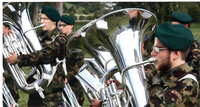
Das Rekrutenspiel 16-2 intonierte vor dem Vorbeimarsch die Nationalhymne und legte während und nach der Veranstaltung Zeugnis ab von seinem imponierenden Können.