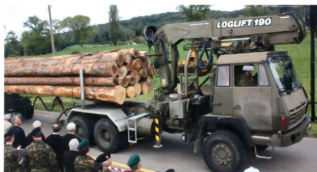
Und noch eine spektakuläre Défilé-Nummer aus der ausgedehnten Kolonne des Katastrophenhilfebataillons 23: Ein Langholz-Transporter in voller Länge.