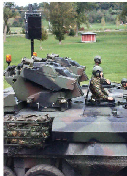
Panzerjäger des Aufklärungsbataillons.