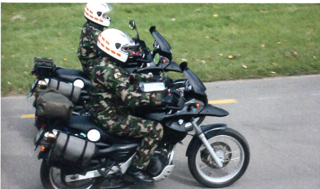
Die Motorradfahrer ziehen in präziser Formation vorbei.