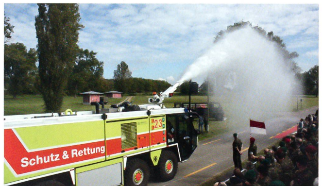
Schutz & Rettung Zürich mit spritziger Einlage ab Fahrzeug.