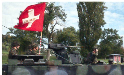
Das Geb Inf Bat 48.