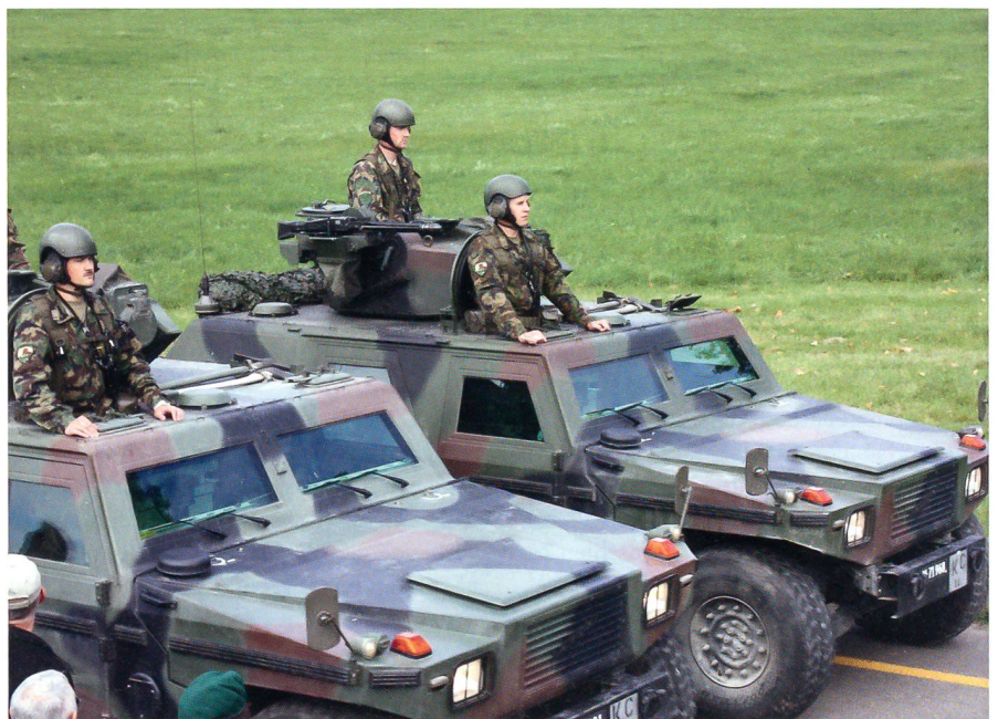
In guter Ordnung defilieren am 29. September 2010 fünf Bataillone der Armee.