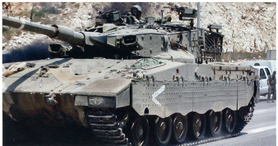
Tals Panzer, der «Streitwagen» Merkawa, im Zweiten Libanonkrieg am 19. Juli 2006.

Die Ägypter lenkten ihre Sagger im Sinai auf Distanzen bis zu 4000 Metern ins Ziel. Die israelischen M-60 und Centurion