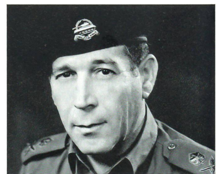
Generalmajor Israel Tal, 1924 bis 2010.

Statt der artreinen Kampfpanzer-Verbände führten die Israeli nun Kampfgruppen ins Gefecht, in der Kampfpanzer, Schützenpanzer, Panzergrenadiere, die Artillerie und Panzersappeure meisterhaft zusammenwirkten. Selbst die Luftwaffe griff im Erdkampf erfolgreich ein, obwohl auch sie im Kampf gegen die Sam-2, -3 und -6 Verluste hatte einstecken müssen. Dann entwickelte Tal seinen Panzer, den Mer-