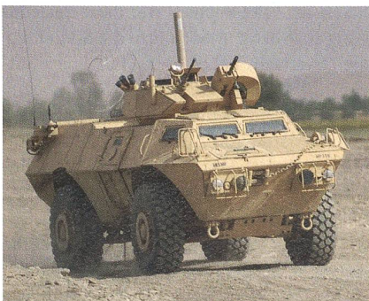
Ein M1117 eines amerikanischen MP-Bataillons auf Patrouille in Afghanistan.

Die afghanischen Streitkräften haben beim amerikanischen Hersteller Textron Marine & Land Systems 400 gepanzerte Radfahrzeuge des Typs M1117 bestellt. Das Fahrzeug wird in Afghanistan bereits durch die US Army und die bulgarischen Streitkräfte eingesetzt. Mit dem Geschützturm, welcher über ein schweres MG im Kaliber .50 sowie einen 40mm-Granatwerfer verfügt, hat der M1117 eine höhere Feuerkraft wie die eingesetzten Humvees, und seine Form sowie die Konstruktion machen ihn sicherer gegen Landminen und Sprengsätze.