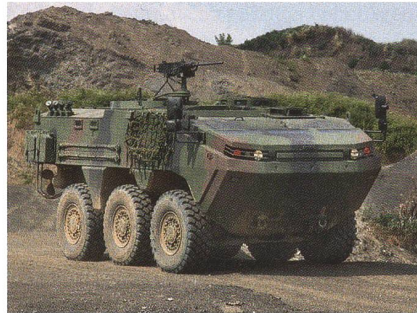
Radschützenpanzer Otokar ARMA auf Testfahrt im Gelände.

Otokar, einer der führenden Hersteller von gepanzerten Fahrzeugen in der Türkei, hat von Malaysia einen Auftrag über 63 Millionen US-Dollar zur Lieferung von Radschützenpanzern des Typs ARMA erhalten. Die Auslieferung des gepanzerten taktischen 6x6 Radpanzers soll im Jahr 2012 beginnen. Der ARMA ist das neueste Produkt