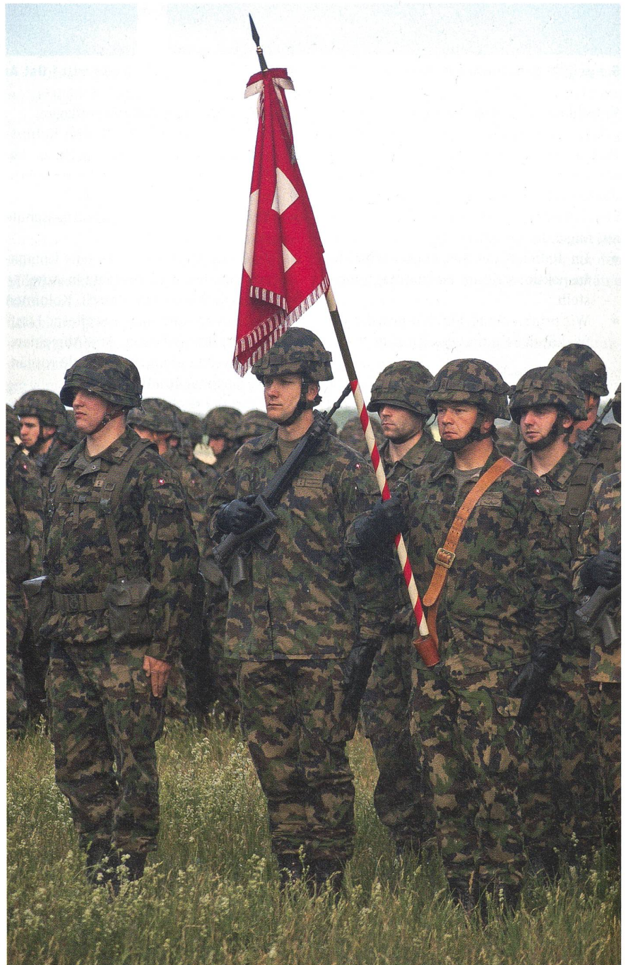
Die Fahnenzeremonie im Pz Bat 13 mit dem Fähnrich und der Fahnenwache.

Hier muss keiner motiviert werden. Ein junger Panzer-Zugführer sagt: «Es ist super, mit dieser neuen Waffe zu arbeiten – aber das schwere Teil geht ganz schön in den Rücken», moniert sein Kollege. Stabs-