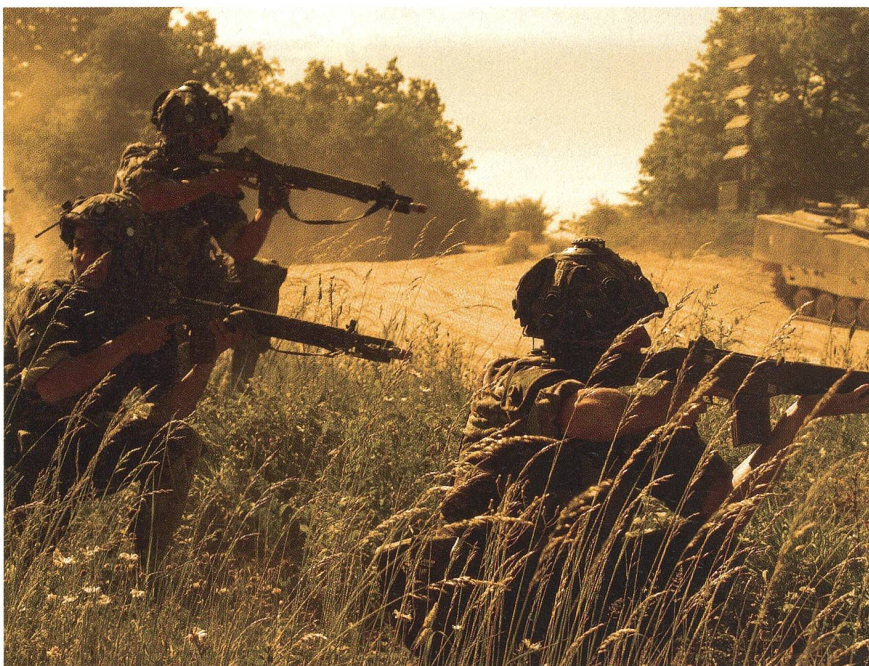
Bure, wie es leibt und lebt: Panzergrenadiere stossen durch ein Engnis.

zu retten und riskiert dabei, selber abgeschossen zu werden (SIM).»