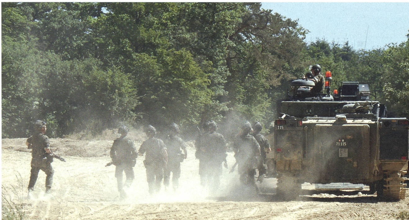
Gemäss einer alten Soldatenweisheit kennt Bure nur entweder Staub oder Schlamm (plus Eis).

23.30 Uhr, in einer Halle der Logistikkompanie brennt noch Licht. Bei einem Schützenpanzer ist Öl ausgelaufen. Doch