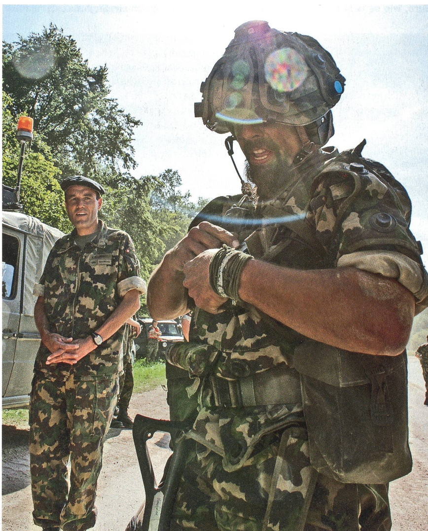
Volles Engagement kennzeichnet das Panzerbataillon 13.