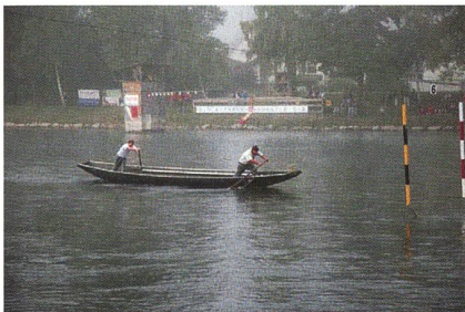
Jungpontoniere auf der Aare.

Nachdem zwei Parcours durch die Zuständigen im OK erarbeitet worden waren, wurden diese vom Verband abgenommen und genehmigt. Danach galt es die diversen Wettkampfbauten zu erstellen und die be-