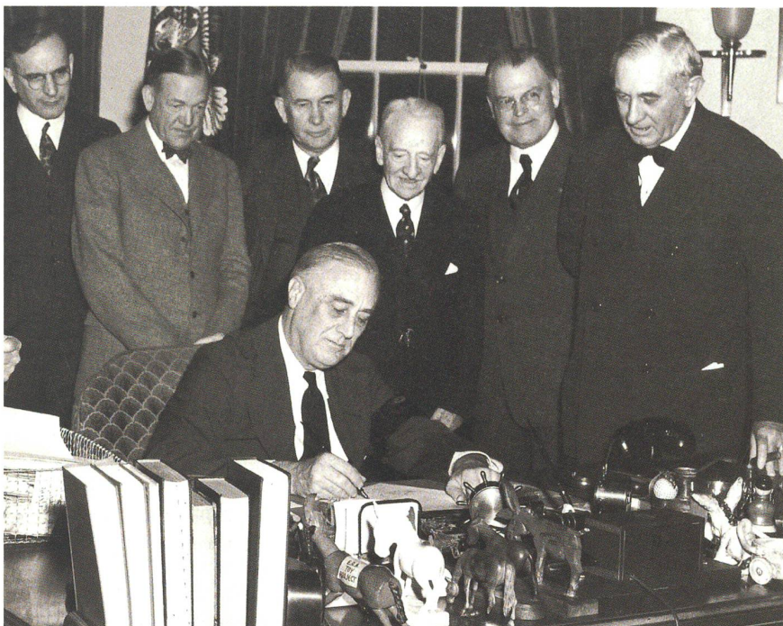
Präsident Franklin Roosevelt unterzeichnet am 8. Dezember 1941 im Beisein von Kongressabgeordneten im Weissen Haus die Kriegserklärung an Japan.