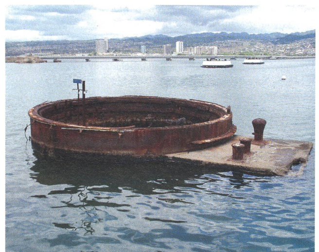
Die Überreste eines Geschützturms der USS «Arizona» ragen noch immer aus dem Wasser. Die sterblichen Überreste der 1177 Seeleute sind an Bord geblieben.