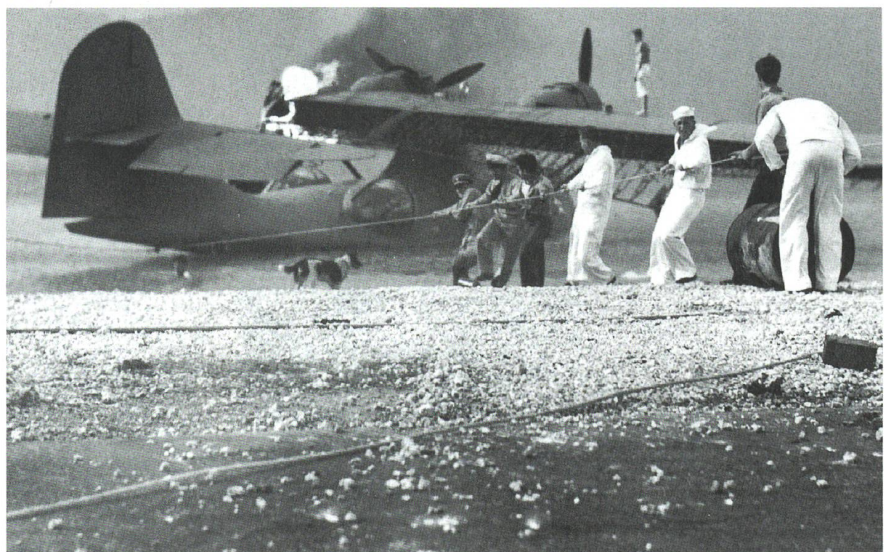
Ein Patrouillenflugzeug PBY Catalina wird nach dem japanischen Angriff von Matrosen weggezogen.

Um allfällige amerikanische Einheiten zu bekämpfen, wurde eine Formation von 27 U-Booten vorausgeschickt. Diese sollte auch zur Aufklärung dienen. Der Hauptverband bestand im wesentlichen aus sechs grossen Flugzeugträgern (Akagi, Kaga, Hiryu, Soryu, Zuikaku und Shokaku), zwei Schlachtschiffen, zwei schweren und einem leichten Kreuzer.