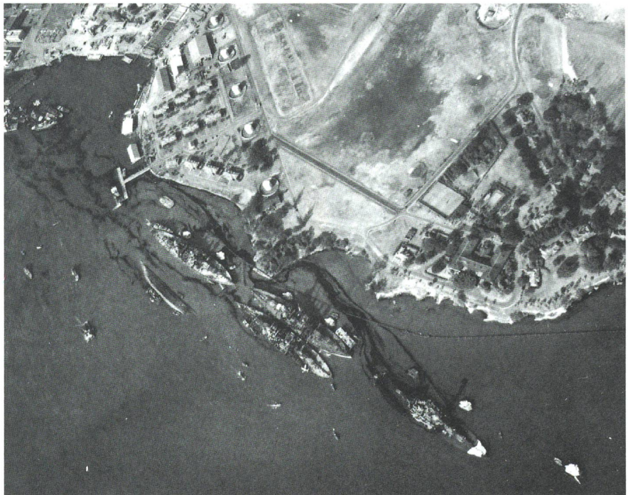
Luftaufnahme kurz vor dem Angriff der japanischen Marine auf Pearl Harbor mit der Battleship Row, unten rechts die USS «Nevada» (BB-36), daneben im Zweierpaket die USS «Arizona» (BB-39), näher beim Ufer gelegen.

Am 2. November 1941 soll die japanische Regierung und das Imperiale Generalhauptquartier – wohl mit dem Segen des Kaisers – den Entscheid für einen Krieg gegen die USA und Grossbritannien gefällt haben. Admiral Yamamoto wies daraufhin