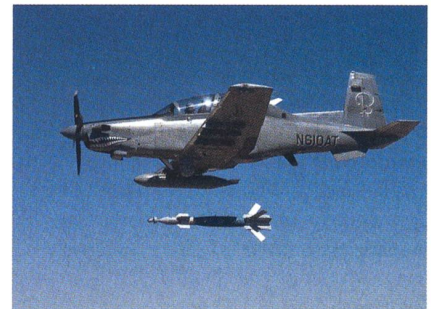
Abwurf einer lasergelenkten Bombe von einem AT-6.

Hawker Beechcraft Defense Company (HBDC) hat bekannt gegeben, dass sie eine Reihe von Abwürfen von präzisions-