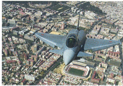
Spanischer Eurofighter über Sevilla.

Die spanische Luftwaffe hat die 300. Maschine des von den vier Partnerunternehmen des europäischen Konsortiums gefer-