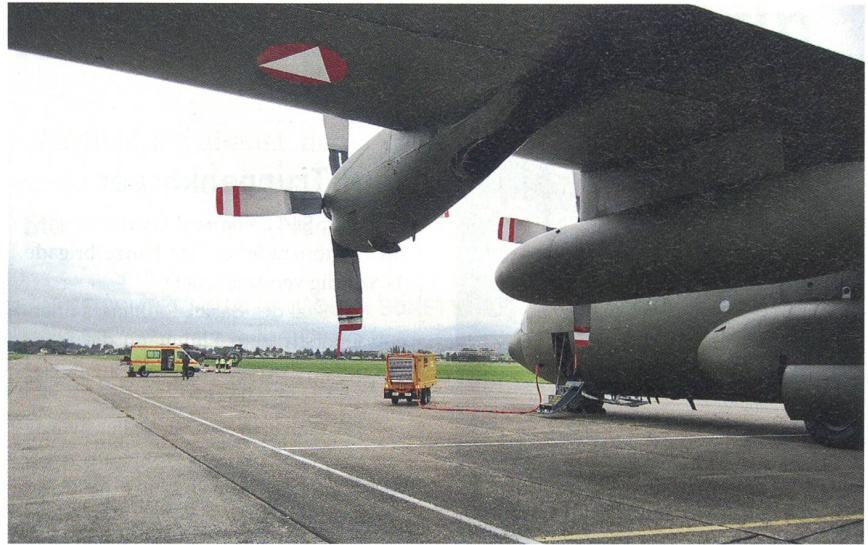
Auf dem Flugplatz Dübendorf: Unter einem der gewaltigen Flügel der Hercules.