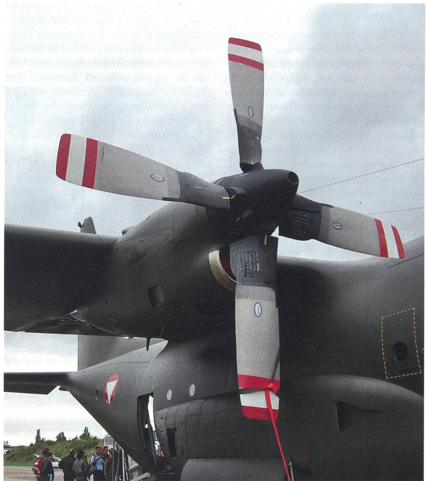
Internationale Luft in Dübendorf: Ein Eindruck von der mächtigen Hercules C-130K.

NATO Partnerschaft für den Frieden (Partnership for Peace PfP), 1994 eingerichtet. Die Schweiz ist seit 1997 mit einem individuellen PfP-Programm beteiligt (ohne Beistandspflicht für Nato-Einsätze).