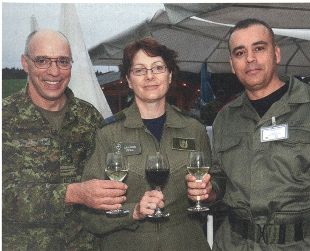
Gäste aus aller Welt zogen Nutzen aus dem Programm.