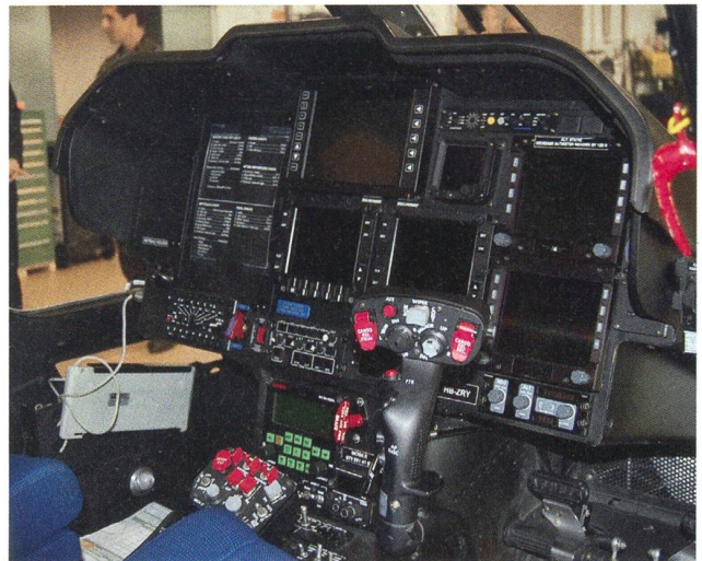
Der Blick in das Cockpit eines Helikopters, der Leben rettet.