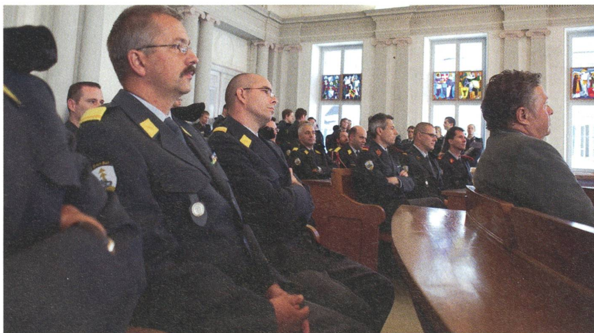
Panzergrenadierbataillon 27 in Glarus: Nachdenkliche Truppen- und Stabsoffiziere.