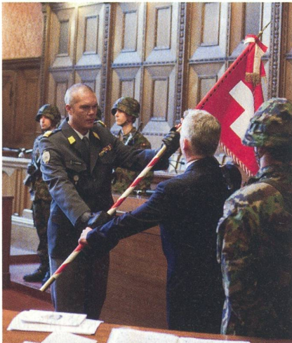
Basel: Das Ende des Panzerbataillons 25.