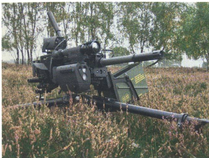
Der automatische 40 mm Granatwerfer «C-16 Automatic Grenade Launcher System», ausgerüstet mit der Feuerleittechnik der Rheinmetall Tochter Simrad Optronics.

Die Rheinmetall Canada Inc., Saint-Jean-Sur-Richelieu, Québec, ist beauftragt worden, Granatwerfersysteme und dazugehörige Munition im Gesamtwert von rund