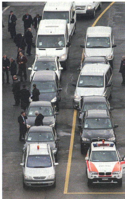
Warten auf einen hohen WEF-Gast: Konvoi mit Sicherheitspersonal, Diplomaten und einer Polizeieskorte.

Wenige Minuten nach der Landung wird die Gangway zum Flugzeug geschoben, der Präsident verlässt die Maschine. Medwedew wird durch sein eigenes Sicherheitspersonal, aber auch durch die Flughafenpolizei geschützt und abgeschirmt. Die Superpumas heben kurz darauf ab. Etwas später kann beobachtet werden, wie ein ganzer Fahrzeug-