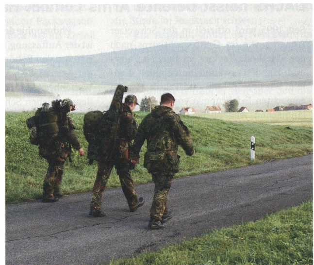
Auch der Marsch mit «Gepäck» gehört dazu.