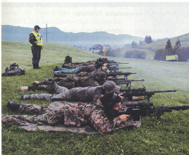
Die traditionelle Schützenlinie auf offenem Feld.