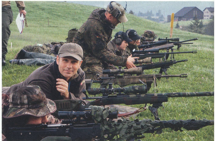
Aus der Schweiz und dem Ausland kamen die Scharfschützen zu «GALLINAGO 2010».

Entsprechend sollte das Handwerkszeug der Teilnehmer in Theorie und Praxis passen, denn ohne die entsprechende Korrektur der Parameter Waffe, ZF und Munition auf die Höhe des Platzes, Wind und