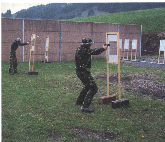
Schützen in der Kurzdistanz-Box auf dem Pistolenparcours.