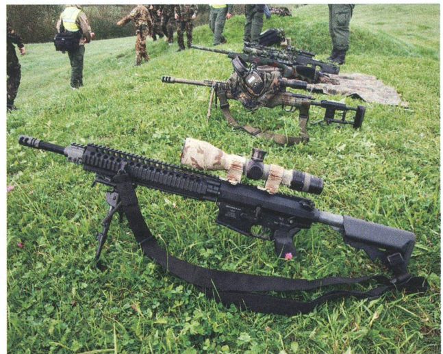
Scharfschützen setzen stets besonders treffsichere Waffen ein.