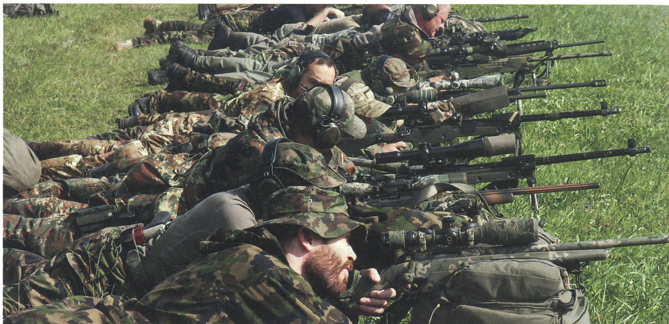
Die Aufnahme von der Schützenlinie vermittelt einen Eindruck von der Vielfalt der eingesetzten Gewehre.

genden elf Stunden wurden die Teilnehmer durch insgesamt 21 Stages geschickt, die das gesamte Spektrum des modernen Scharfschützenwesens beinhalteten.