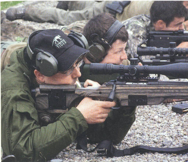
Der Wettkampf «GALLINAGO» erfordert höchste Konzentration.