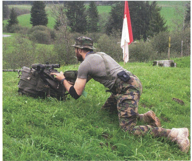
In strengem Einsatz: Scharfschütze bezieht Stellung.