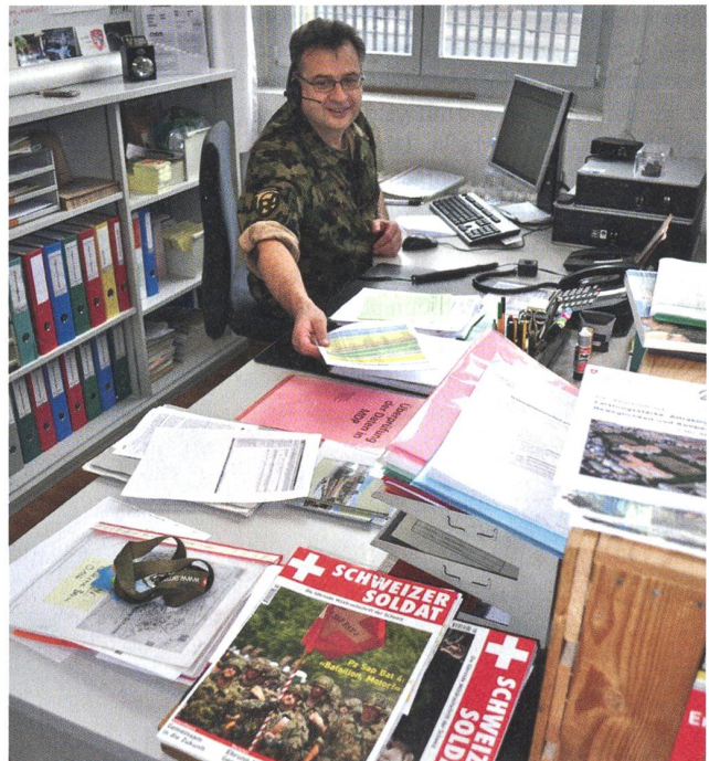
Der SCHWEIZER SOLDAT ist immer präsent und willkommen.