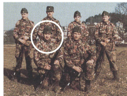
RS 1980 auf der Allmend Luzern.