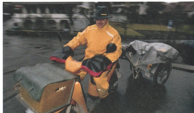
Rassig: Kauer in Gelb – Die Post ist da.