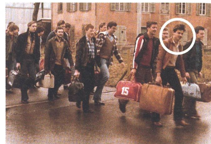
Einrücken in die RS 1980 in Luzern.