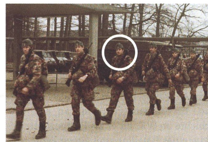
RS 1980 Luzern: Strammer Ausmarsch.

für wichtig hält. Privat fotografiert er gerne und liebt den Wein. Er ist seit 20 Jahren verheiratet.