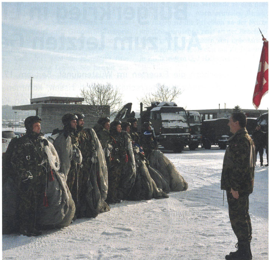
Die Fallschirmtruppe ist vor dem Brigadekommandanten angetreten.