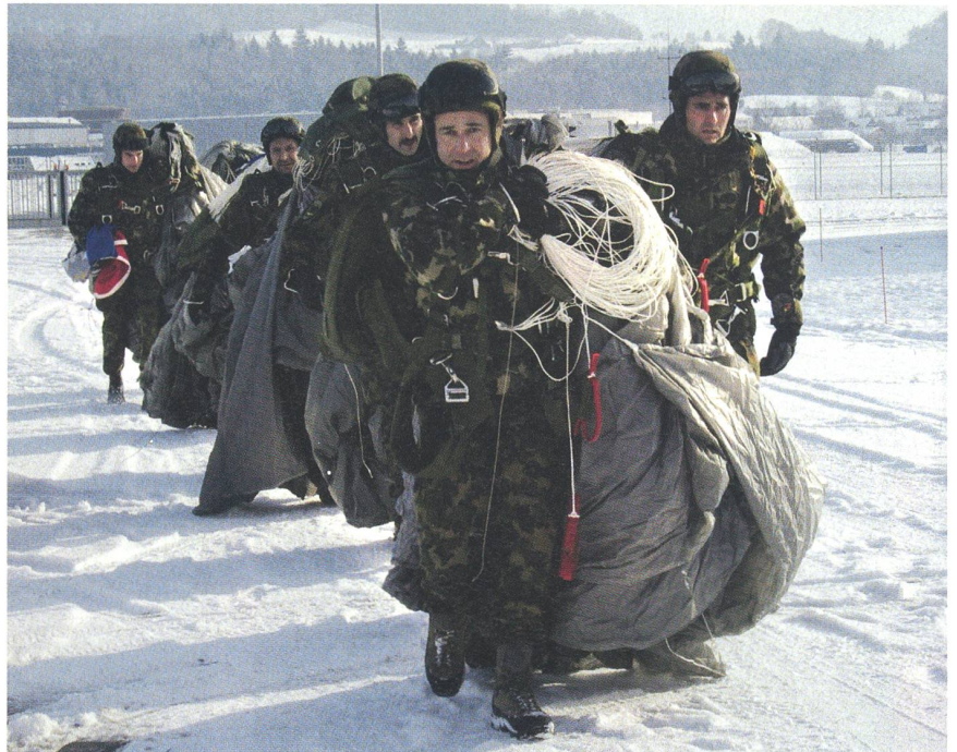
Die Fallschirmspringer rücken an – nach getaner Arbeit.

Er plädierte für Ehrlichkeit gegenüber der Öffentlichkeit und der Politik. Mit dem zur Verfügung stehenden Kostendach von 4,4 Mia. Fr. sei das neue Leistungsprofil schlicht nicht umzusetzen. Hier konnte der höchste AdA keinen Mut machen. Jede wei-