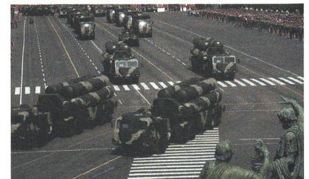
Starterfahrzeuge der «S-400 Triumf» anlässlich der Maiparade 2010 in Moskau.

Die russischen Streitkräfte sind kontinuierlich daran, ihre Luftabwehrkapazität auszubauen. Dabei werden die ins Alter gekommenen Luftabwehrsysteme des Typs S-300 von fortschrittlichen Systemen des Typs S-400