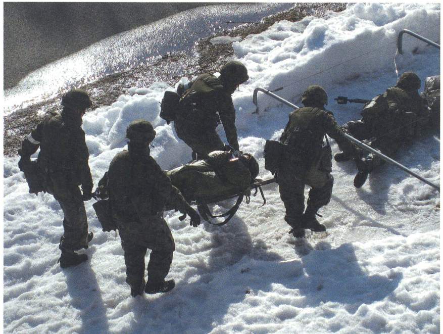
Ein Arbeitgeber von unschätzbarem Wert: In der Leventina kann niemand den Waffenplatz Airolo und die Sanitätsschulen ersetzen (hier der Parcours für die Rekruten).

Die Liste liesse sich beliebig verlängern – um die Kantone Schaffhausen, St. Gallen,