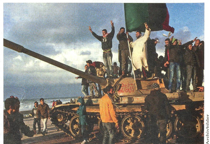
Rebellen mit der grün-schwarz-roten Fahne auf einem T-54/55.