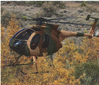
MD-530F im Schwebeflug.

Die afghanischen Streitkräfte bestellen Helikopter im Wert von 186 Millionen US-Dollar beim Hersteller MD Helicopters. In der ersten Tranche werden sechs Hubschrauber des Typs MD-530F zu Ausbildungszwecken geliefert; anschliessend