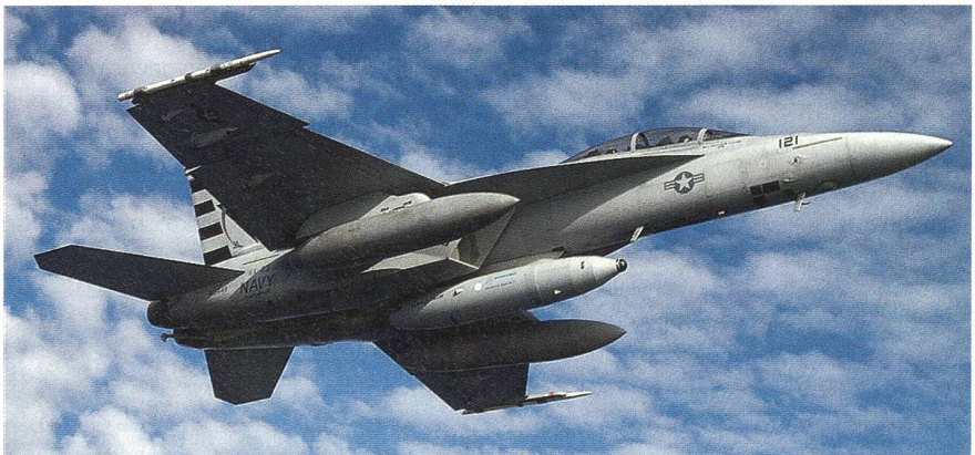
F/A-18 E / F mit IRST-Behälter unter dem Rumpf.