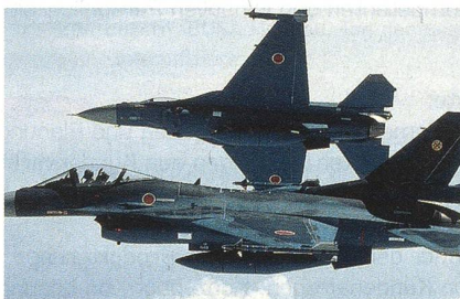
Mitsubishi F-2 im Formationsflug.

Insgesamt sollen 18 Kampfflugzeuge des Typs Mitsubishi F-2 der 21. Trainingsstaffel zerstört oder beschädigt worden sein, welche zum Zeitpunkt des Bebens in Matsushima stationiert war. Die F-2 gleicht auf den ersten Blick der amerikanischen F-16, aus welcher sie auch um einiges weiterentwickelt und angepasst wurde, so dass von einem eigenen Flugzeugtyp gesprochen wird. Der Rumpf der F-2 ist länger, die Kunststoff-Tragflächen sind um einiges grösser und eine komplette Neuentwicklung. Das Mehrzweckradar soll eine Reichweite von 190 km haben; die F-2 war das erste Serienkampfflugzeug der Welt, das mit einem AESA-Radar ausgestattet wurde.