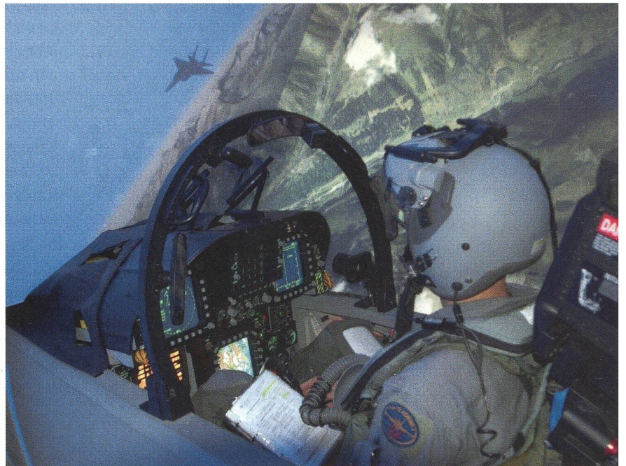
Die Schweizer Luftwaffe verfügt über eine moderne Simulationstechnik.

Die Simulationsanlage besteht aus vier gemäss den Schweizer F/A-18 ausgerüsteten Einsitzer-Cockpits. Die Cockpits kön-