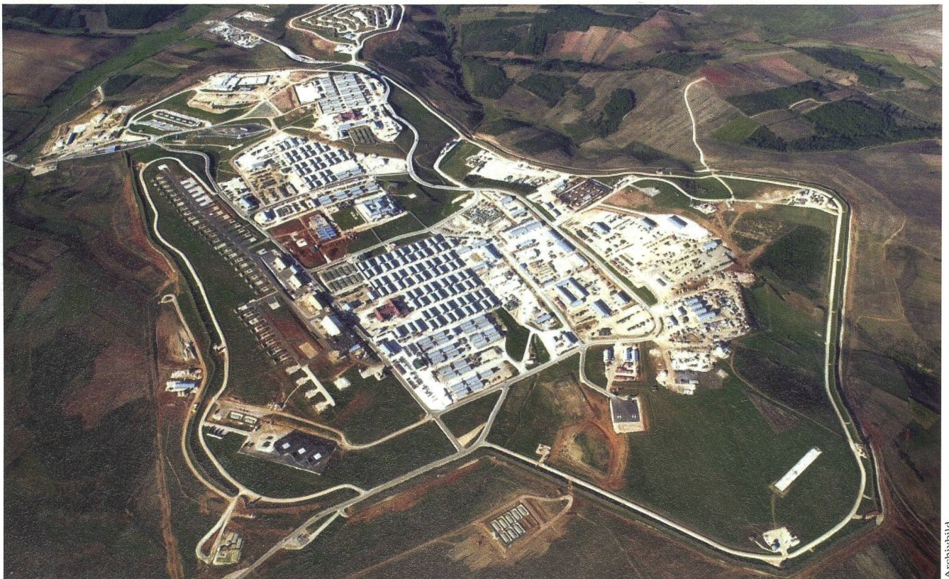
Camp Bondsteel: Von diesem Stützpunkt aus operiert seit dem 18. November 2010 das Schweizer Helikopter-Detachement.

Die Basis ist nach James Leroy Bondsteel, einem Vietnam-Helden, benannt. Bondsteel ist der grösste Stützpunkt, den die USA seit dem Indochina-Krieg bauten. red.