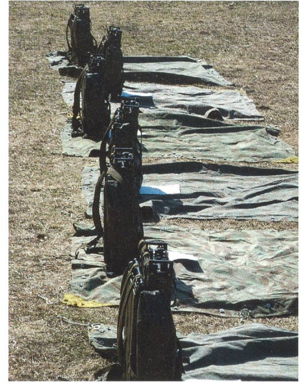
Funkausbildung ist natürlich unabdingbar.