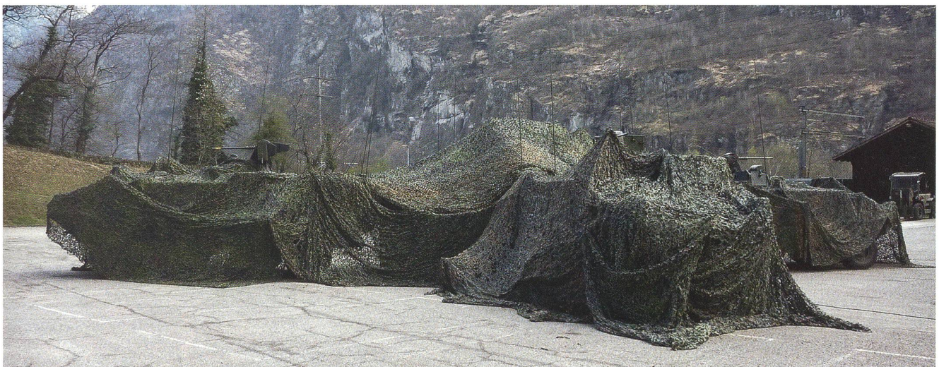
Die mobile Führung: die «Wagenburg» irgendwo in den Alpen.