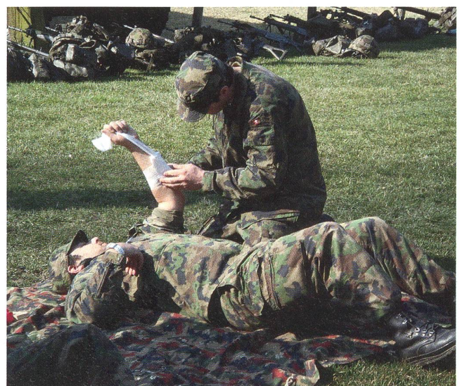
Sanitätsausbildung gehört auch beim Funker zum Grundmetier.