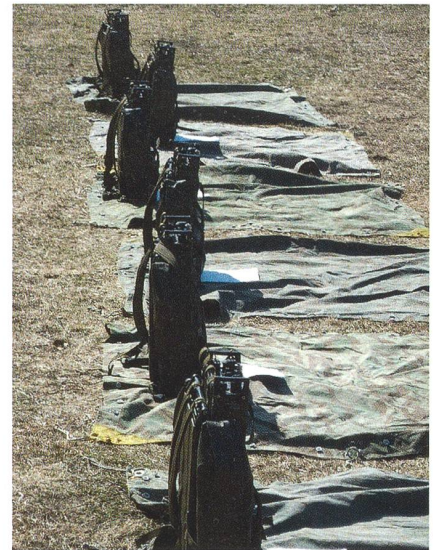
Funkausbildung ist natürlich unabdingbar.