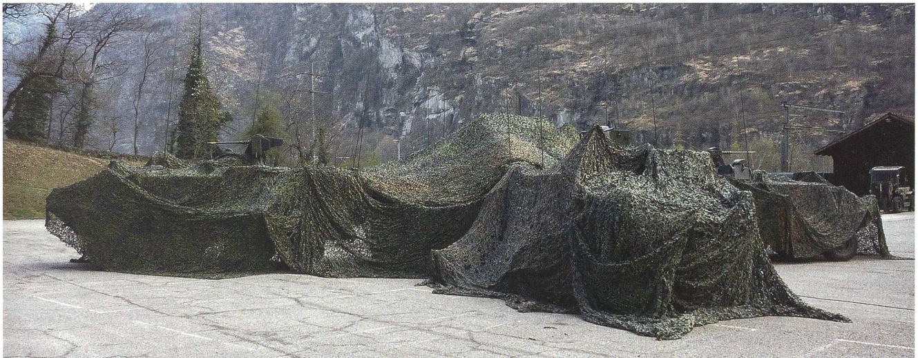
Die mobile Führung: die «Wagenburg» irgendwo in den Alpen.