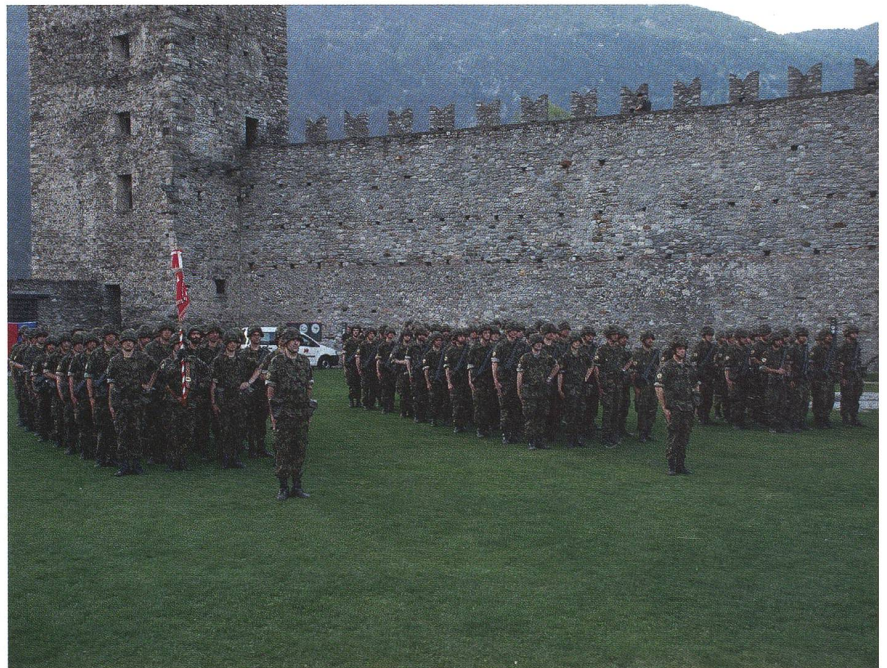
Die Fahnenrückgabe im Castel Grande von Bellinzona.

Sie bot dem Brigadekommandanten Stefano Mossi die Gelegenheit, drei unterschiedliche Ebenen zu trainieren und ihr einwandfreies Zusammenspiel zu testen: Brigadestab, Bataillonsstab und die Truppe an der Front wurden von der Aktionspla-