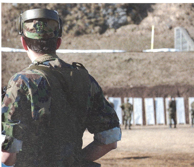
Schiessausbildung in Fontana (Val Bedretto).