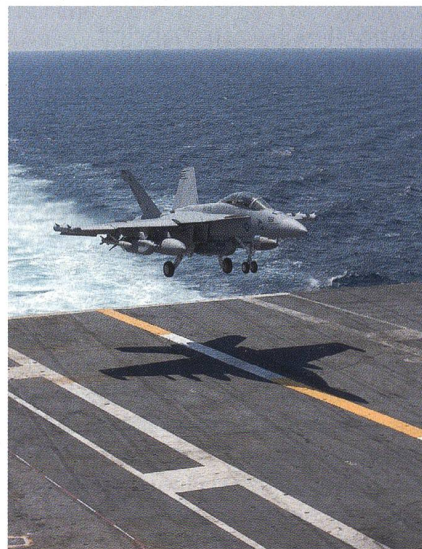
EA-18G Growler kurz vor der Landung auf einem Flugzeugträger.

Boeing und die U.S. Navy haben am 20. April in St. Louis mit der Übergabe des 500. F/A-18E/F Super Hornet beziehungsweise dem EKF-Modell EA-18G Growler einen Meilenstein gefeiert. Die Super Hornet stellt die Speerspitze der Navy dar und wird als topmodernes Mehrzweckkampfflugzeug weltweit eingesetzt. Die EA-18G wird von der Navy zur elektronischen Kampfführung sowie zum Ausschalten