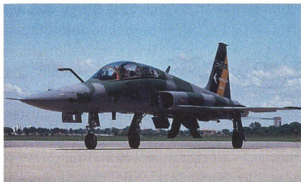
F-5BR mit Luftbetankungssonde.

Die brasilianische Elbit-Tochter AEL Sistemas S.A hat gemeldet, dass in einem Folgeauftrag im Rahmen des F-5BR-Kampfwertsteigerungsprogramms 11 zusätzliche Flugzeuge aufgerüstet werden sollen. Insgesamt