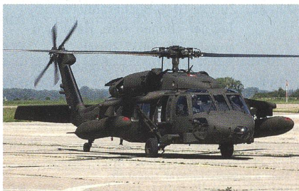
Sikorsky T-70 Black Hawk mit Zusatztanks.

Das türkische Verteidigungsministerium hat bei der Ausschreibung nach einem neuen Mehrzweckhubschrauber, welches unter der Bezeichnung Turkish Utility Helicopter läuft, der Firma Sikorsky, welche mit dem S-70i Black Hawk angetreten ist,