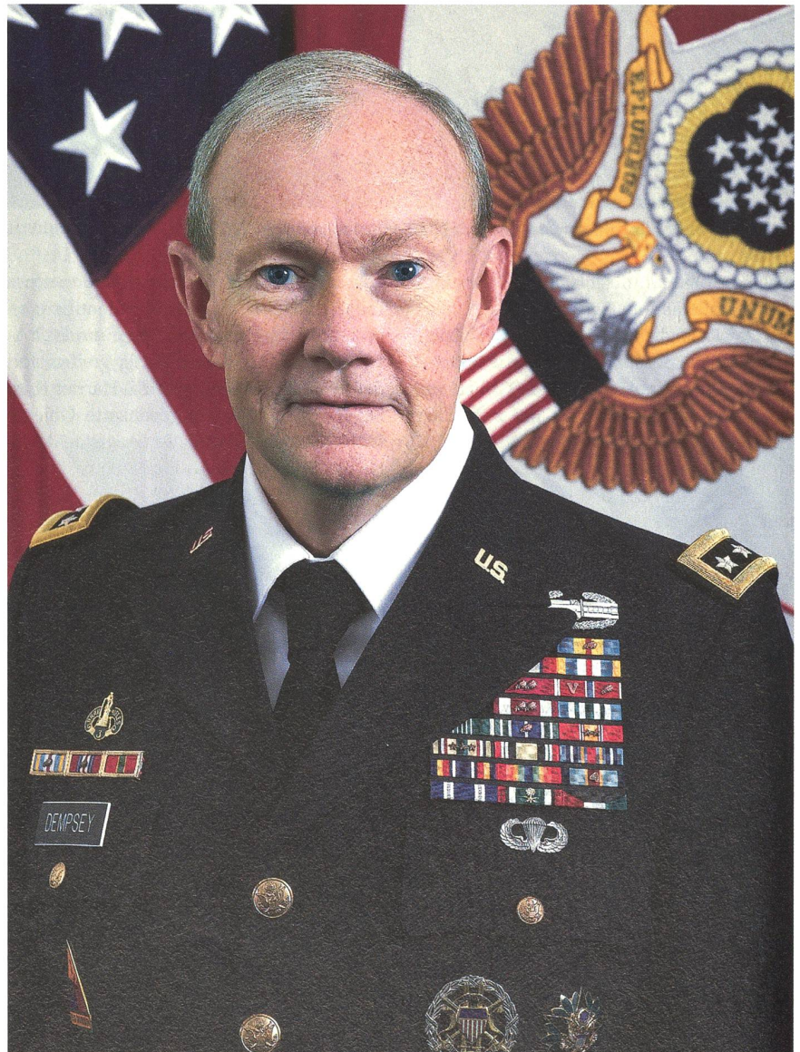
Der neue Chairman Joint Chiefs of Staff, General Martin Dempsey, ist ein Heeresoffizier.

Es wird nun gemutmasst, dass Verteidigungsminister Gates und Admiral Mullen gegen die Wahl des eher introvertierten und stark auf Hochtechnologie setzenden Cartwright gewesen seien, weil sie sich in dessen Ratschlägen ans Weisse Haus übergegangen gefühlt hätten, aber auch weil sein