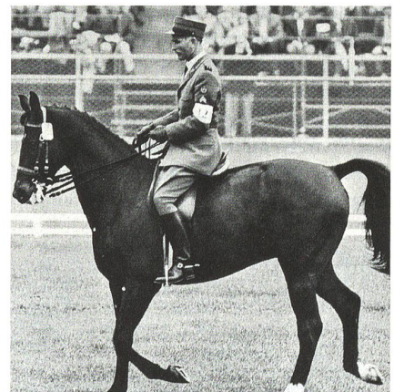
Chammartin auf Woermann.

Chammartin war ein eleganter, souveräner Dressurreiter, wie es ihn seither kaum