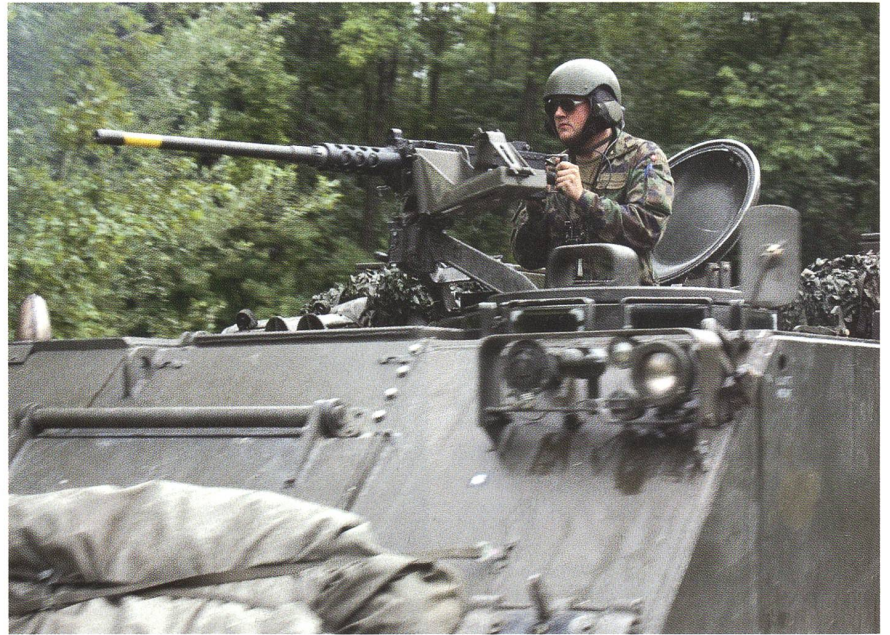
In den Vaterschaftsurlaub statt in den WK? Eine Bieridee – mitten im Wahlkampf!

Denn der Korpsgeist, der unseren Einheiten im Katastropheneinsatz oder im Gefecht die Leistungsfähigkeit der Verbände entscheidend verbessert und das Vertrauen der Soldaten in ihre Kameraden an ihrer Seite spiegelt, kann nicht befohlen werden, er muss gelebt werden. Genau dies