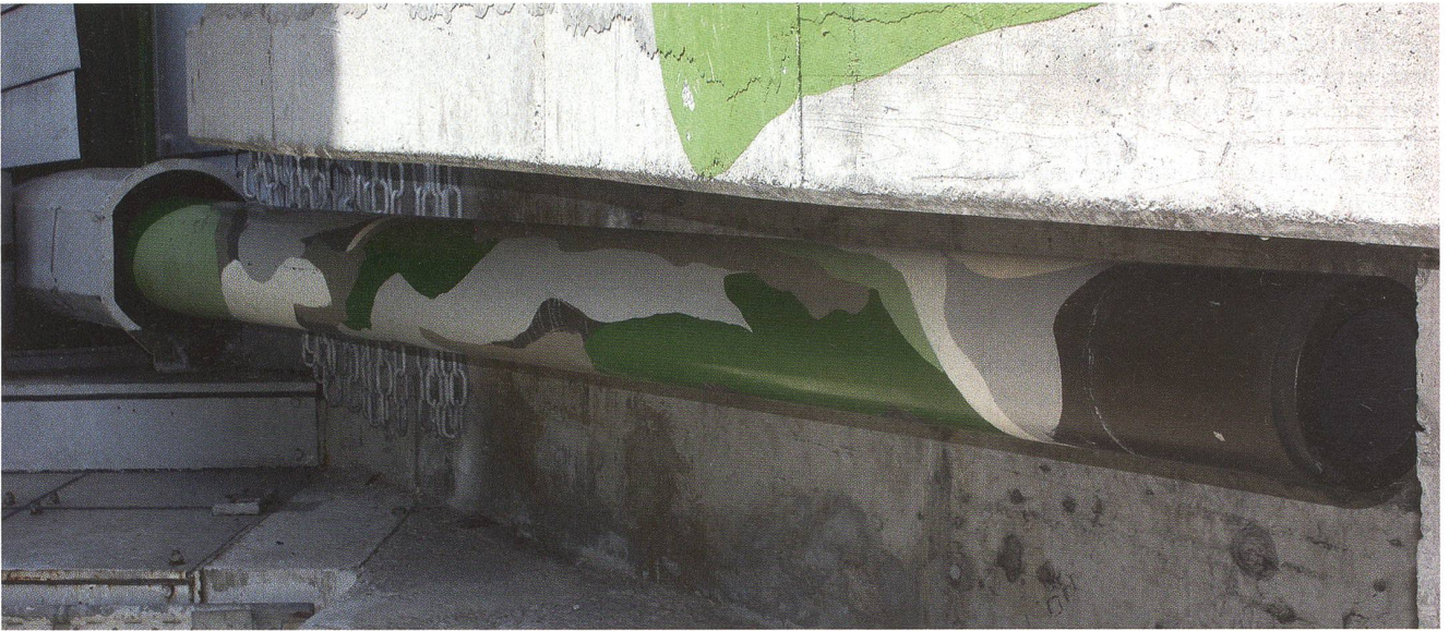
Das mächtige 155-mm-Rohr in der «Rohrgarage». In der «Garage» wird das Rohr sozusagen «parkiert».

Funktion aufzugeben und den vollständigen Rückzug der gesamten Schweizer Armee ins Réduit.