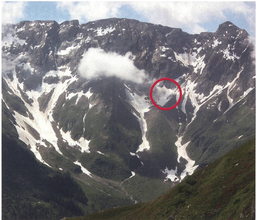
«Schuss im Ziel» – der rote Kreis bezeichnet das Ziel irgendwo im Alpenraum.

Im Bericht des Bundesrates an die Bundesversammlung über die Sicherheitspolitik der Schweiz 2010 heisst es bezüglich der Weiterentwicklung der Armee konkret, dass die veralteten Festungsanlagen (12 cm Festungsminenwerfer und 15,5 cm Festungskanonen «BISON») und die nicht mehr benutzbaren permanenten Sperrstellen so rasch als möglich stillzulegen seien. Dazu, wie die daraus entstehenden Fähig-