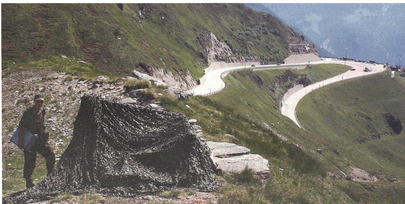
Irgendwo an einer transalpinen Passstrasse hat sich der Schiesskommandant gut und zweckmässig eingerichtet.

Die Eröffnung des Gotthardtunnels 1882 stellte fortan die kürzeste Verbindung zwischen Deutschland und Italien dar. Da Deutschland, Italien und Österreich-Ungarn sich zum Dreibund zusammenschlossen, stand die Schweiz nun als wichtiges Durchgangsland im Zentrum. Diese Umstände veranlasste die Schweiz noch vor Ausbruch des Ersten Weltkriegs mit erneuten Befestigungsarbeiten zu beginnen, einerseits im Tessin, andererseits auch auf der Nordseite.