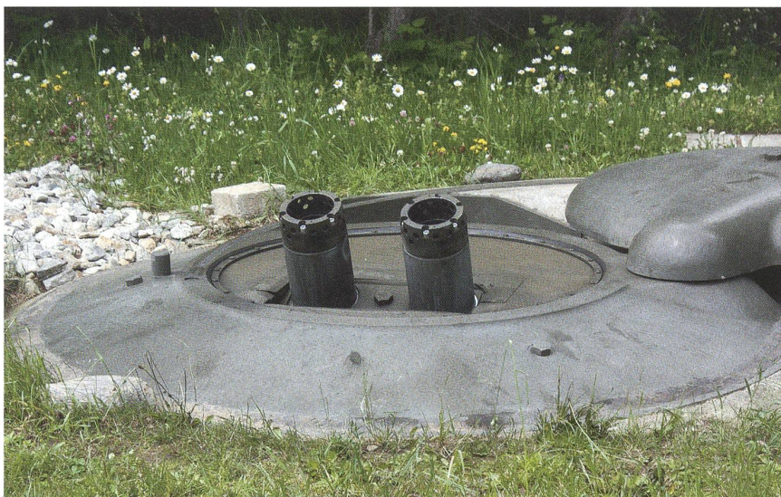
Der Zwilling-Minenwerfer 12 cm, ein überaus präzises Geschütz.

Der Operationsbefehl Nr. 13 sah vor, die vorgeschobene Stellung als operative