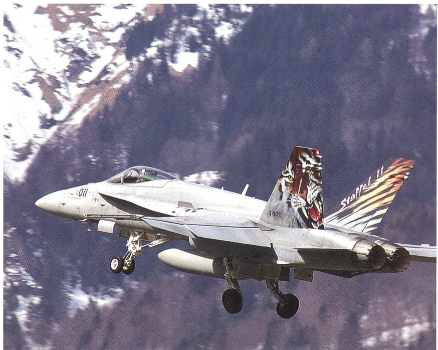
Nach wie vor gehört der Luftpolizeidienst zu den vorrangigen Pflichten: Der F/A-18.

Lange wurde in Europa bezüglich der Raketenabwehr wenig unternommen. In der Zwischenzeit hat die NATO entspre-