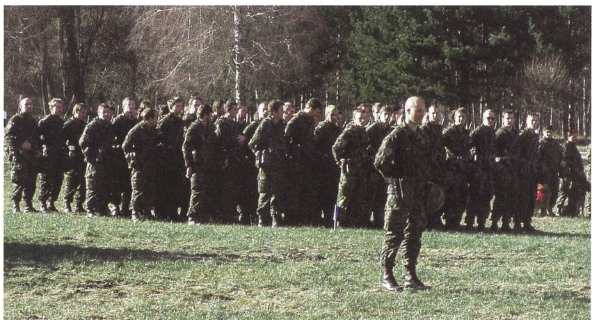
Überall, wo Hilfe geleistet wird, braucht es mannschaftsstarke Armeen.

Noch einmal: Armeen wurden nicht in erster Linie zur Katastrophen-Bewältigung geschaffen. Aber dank ihrer Mannschaftsstärke erbringen Armeen in Katastrophen Leistungen, die keine andere Organisation in vergleichbarer Effizienz erbringen kann. In Japan steht derzeit die ganze Armee im Katastropheneinsatz – kompetent, trotz der unermesslichen